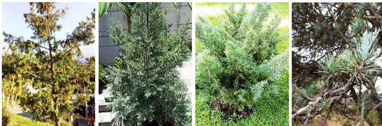
Figure 1. A. Chamaecyparis lawsoniana , B. Cupressus arizonica var. glabra , C. Juniperus chinensis f. pfitzeriana , D. Cedrus deodara .

Dist.-origen: Afganistán, Kurram al este de Kashmir y oeste de Nepal (Nasir and Ali 1980-2005).