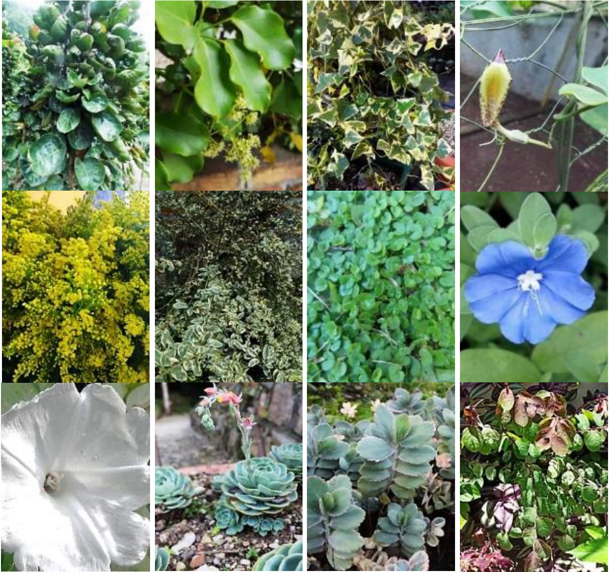
Fig. 4. A. Tetragnonia tetragonoides , B. Alternanthera sissoo , C. Anethum graveolens , D. Plumeria pudica , E. Polyscias scutellaria , F. Schefflera elliptica , G. Hedera hélix , H. Aristolochia constricta , I. Solidago canadensis , J. Euonymus japonicus , K. Dichondra microcalyx , L. Evolvulus glomeratus , M. Ipomoea pauciflora , N. Echeveria elegans , O. Kalanchoe fedtschenkoi , P. Breynia disticha .