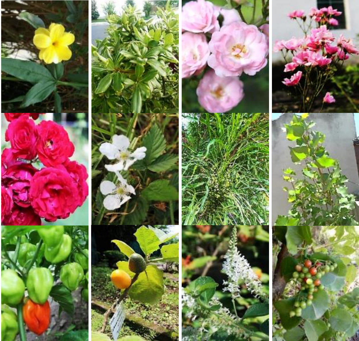
Fig. 5. A. Coleus hadiensis , B. Coleus madagascariensis , C. Lavandula dentata , D. Norantea guianensis , E. Jasminum mesnyi , F. Pittosporum tobira , G. Rosa x centifolia , H. Rosa multiflora , I. Rosa odorata , J. Rubus fruticosus , K. Melicope denhamii , L. Populus nigra var. italica , M. Capsicum chinense , N. Solanum sessiliflorum , O. Aloysia virgata , P. Cissus rotundifolia .