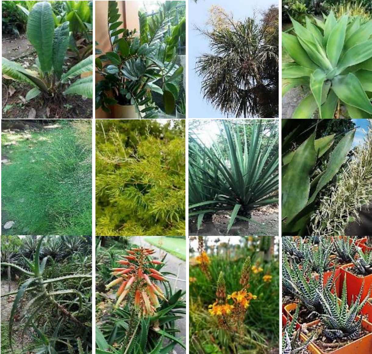
Figure 2. A. Scadoxus multiflorus , B. Tulbaghia violacea , C. Crinum jagus , D. Monstera obliqua , E. Philodendron campii , F. Zamioculcas zamiifolia , G. Sabal mauritiiiformis , H. Agave attenuata I. Asparagus plocamoides . J. Asparagus retrofractus , K. Furcraea macdougallii , L. Sansevieria hyacinthoides , M. Aloe arborescens , N. Aloiampelos ciliaris , O. Bulbine frutescens , P. Hawortia attenuata .