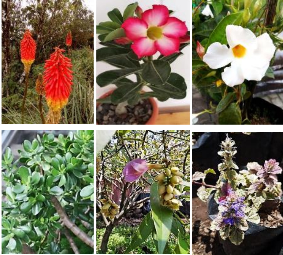
Fig. 6. A. Cupressus cashmeriana , B. Wodyetia bifurcata , C. Agave vilmoriniana , D. Kniphofia uvaria , E. Adenium obesum , F. Mandevilla sanderi , G. Crassula ovata , H. Clitoria fairchildiana , I. Ajuga reptans .