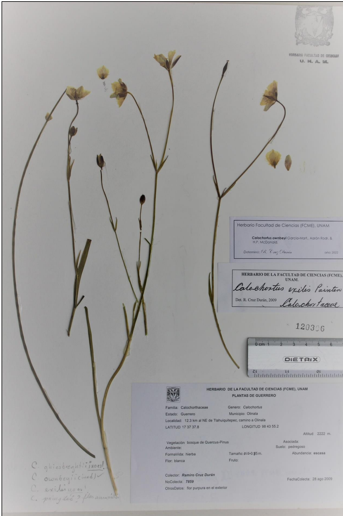
Figura 2. Calochortus ownbeyi , Cruz 7859 (FCME).