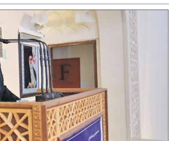
واعظی در نماز جمعه گرگان:

رئیس دفتر رئیس جمهوری در جلسه شورای اداری استان گلستان در جمع مدیران و مسئولان این استان با سردمیران دهه مبارک فجر و چهل و یکمین سالگرد پیروزی انقلاب و شکوهمند اسلامی، تأکید کرد: در دولت