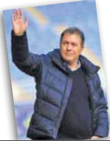
بالاخره جانشین ویلموتس مشخص شد اسکوچیچ روی نیمکت تیم ملی فوتبال ایران