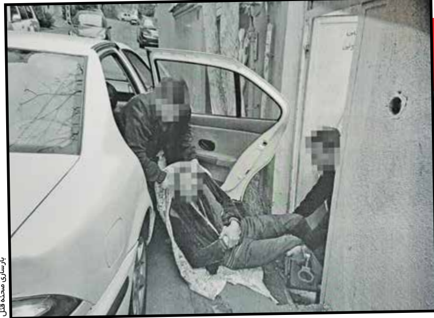
بازرسی صحنه قتل

سرانجام چند روز قبل این زن به شعبه ۱۲ دادگاه رفت و در نخستین جلسه تحقیق به تشریح ماجرا پرداخت. وی به قضات گفت: من چون برای رسیدن به خانه‌ام و دستگیر کننده.