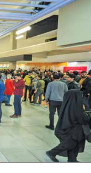
استقبال مردم از جشنواره فیلم فجر در پردیس سینمایی سیتی سنتر اصفهان