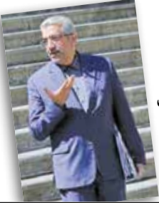
وزیر نیرو اعلام کرد افزایش ۱۲ برابری ظرفیت تولید برق در ۴۲ سال