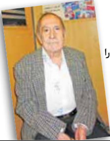
به بهانه برگزاری «شب بهمن فرزانه» در سلسله شب‌های بخارا این دیگر فرزانة نیست