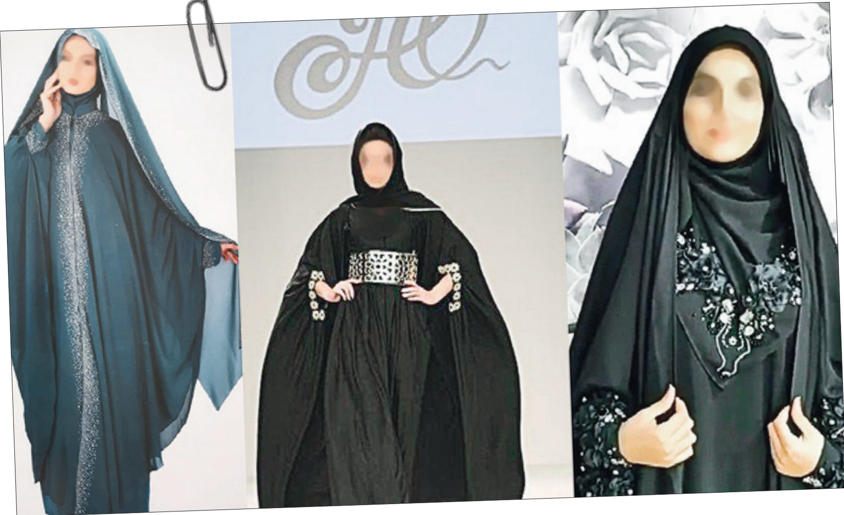
گفت‌وگویی «جوان» با مدیرعامل انجمن تولیدکنندگان محصولات حجاب و عفاف

حجاب استایل‌ها اگر چه به ظاهر در زمینه عرضه کالای حجاب فعالیت می‌کنند اما پوشش لاکچری ترویج شده از سوی این افراد با فلسفه حجاب فاصله زیادی دارد و به موضوع حجاب و عفاف ضربه می‌زند