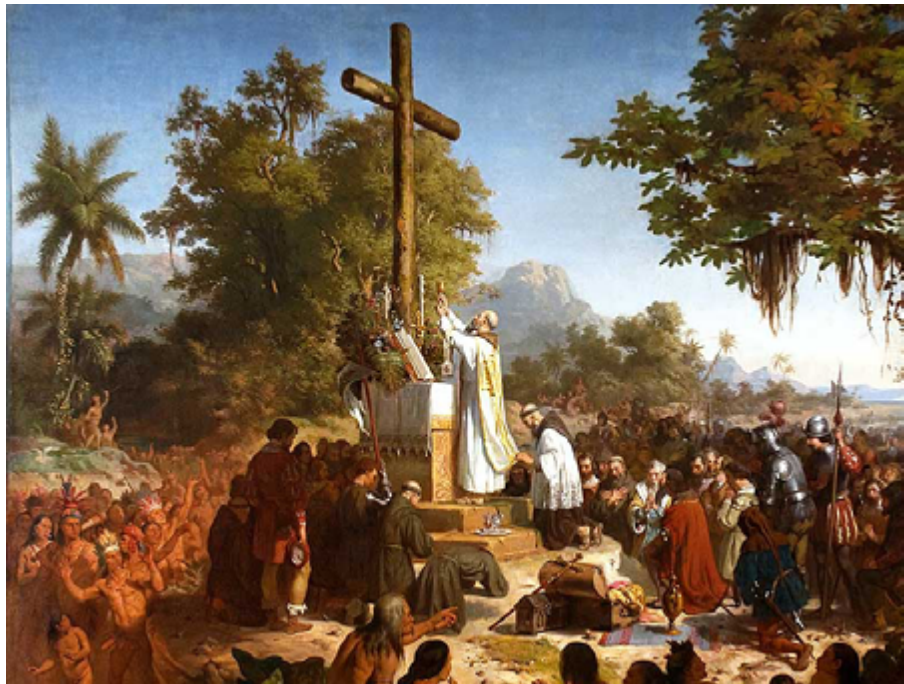
La concepción católica tradicional de las Misiones

En la doctrina misiológica de la Iglesia, tradicional de cerca de veinte siglos, el concepto de Misión católica, sus fines y sus métodos, están perfectamente definidos, y coincide con el modo de ver y de sentir del lector brasilero medio.