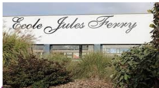
Association des parents d"élèves – APE Kevredigezh Tud ar Vugale