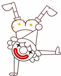
Cirque/Dessin Association l'Obelle Sirk / tresañ Ar gevredigezh L'Obelle