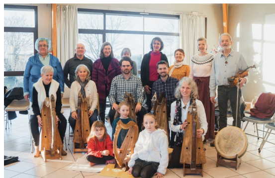
Musique : Harpe Sonerez : Telenn