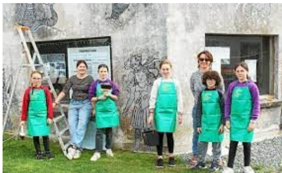
Arts plastiques Arzoù neuziañ