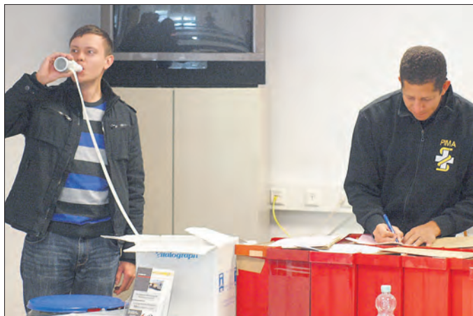
„Lungenfunktionstest“: hier ein Kamerad der FF Wurzbach.

Zusammenarbeit mit der PIMA Arbeits- und Umweltmedizin GmbH.