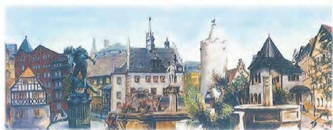
Pastellcollage von Theo Böttcher

Tatsächlich gibt es einige Erzeugnisse, die es nur hier zu kaufen gibt. Ein ganz individuelles Mitbringsel oder Geschenk ist auf jeden Fall die Pößneck-Tasse mit Stadtmotiven, Ansteck-Pin in Form des Pößnecker Stadtlogos, Tragetasche mit Pößnecker Stadtwappen in den Farben gelb und weiß, Gutscheinkarte mit einer Pastellcollage „Pößnecker Ansichten“ aus Motiven des Pößnecker Pastellmalers Theo Böttcher sowie CDs und Postkarten.