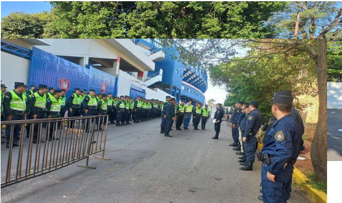
Formación y Cobertura de Seguridad del Estadio Gral. Pablo Rojas, para el encuentro de fútbol entre los equipos de Cerro Porteño vs. Nacional.