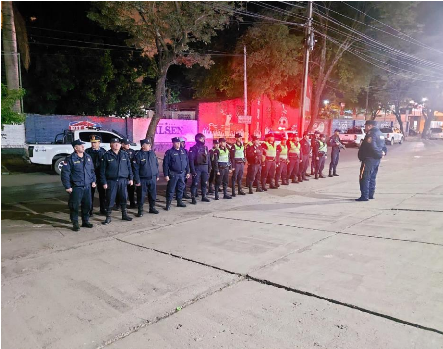
Cobertura del personal policial para cobertura de seguridad en inmediaciones del Tribunal Superior de Justicia Electoral.