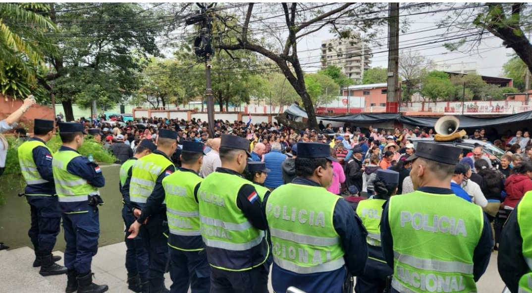
Formación y Cobertura de Seguridad del Estadio Manuel Ferreira, para el encuentro de fútbol entre los equipos de Olimpia vs. Gral. Caballero.