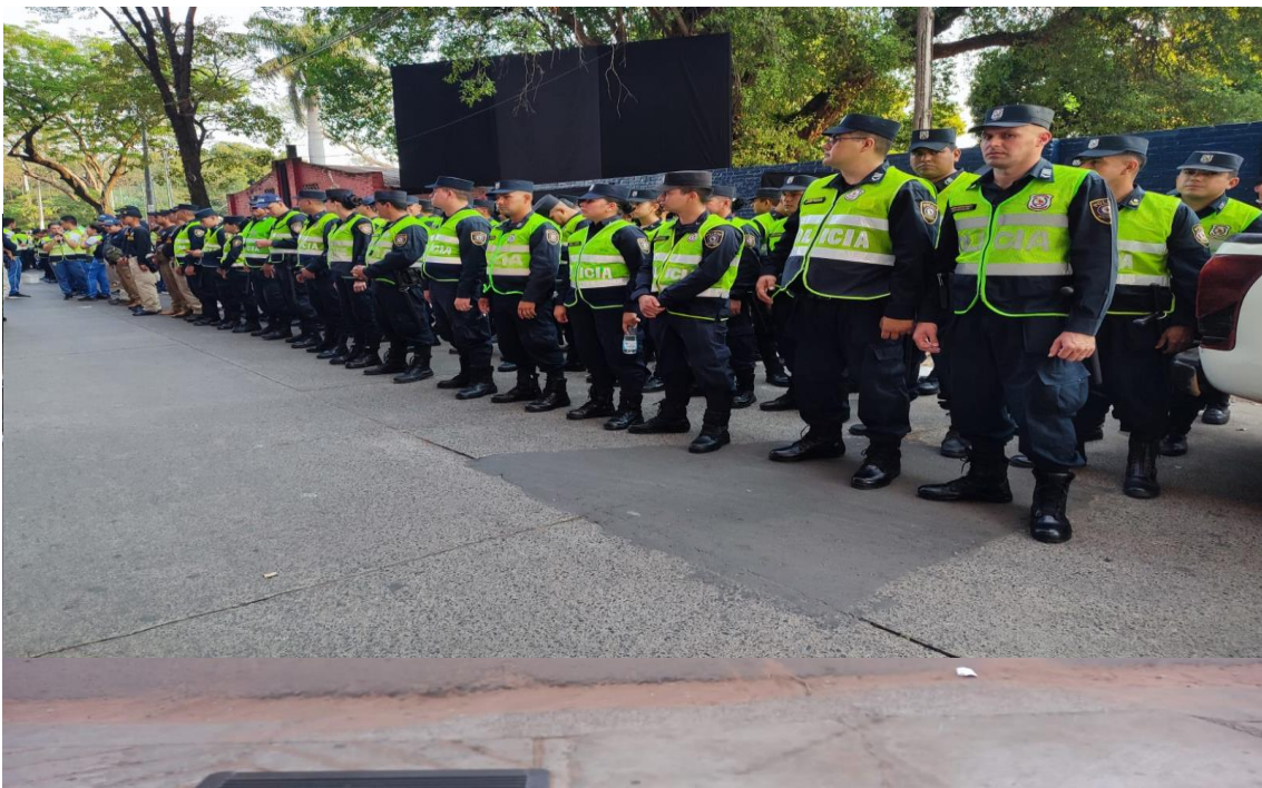
La Policía realiza cobertura de seguridad durante ingreso de alumnos en varias Instituciones Educativas.