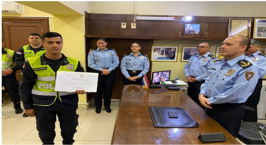
Reconocimiento del Señor Comandante de la Policía Nacional al personal interviniente en enfrentamiento con delincuentes en un hecho de robo agravado.