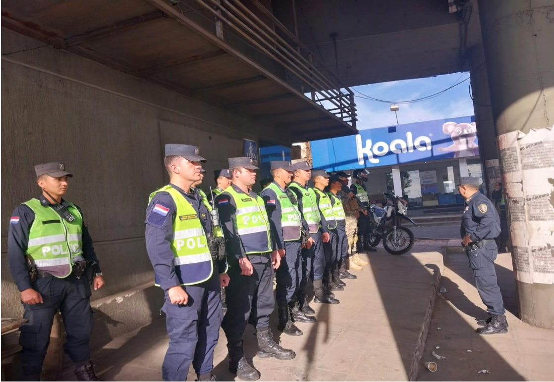
Cobertura de Seguridad en manifestaciones ciudadanas en el microcentro de Asunción.