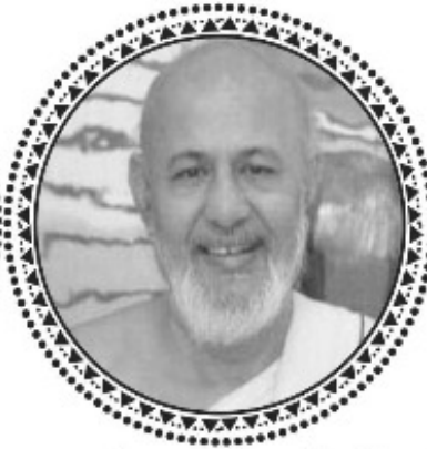
गच्छ गौरव, प.पू. गुरुदेवश्री सर्वोदयसागरशु म.सा.