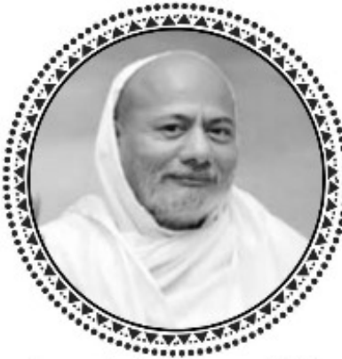
ध्यान योगी - प.पू. मुनिश्री उदयरत्नसागरशु म.सा.