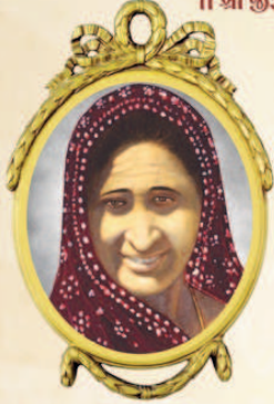
मातुश्री जेडीनाई धारशीभाई मोता

“भेरा गाम तेरा” ना हुलाभणु नामे ओणभानुं, पांजे कच्छना हेरीटिज वीलेजमां स्थान पामेलुं, ज्यां छत्रवल्ला अने शामलीया पार्श्वनाथज्जनी अखित्य कृपा अनाराधार वरसी रही छे. भोजनशाणा अने अतिथिगृहनी सुवाडु व्यवस्था लोकाना हृदयमां मोभरानुं स्थान धरावे छे. तेरा पांजरपोणमां गाय-वाछरडानी सार संभाण सारी रीते लेवाई रही छे, अेवा तेरा गाममां सभ्मीटील दाताओनी धनवर्धनी कारणे आठ (अेसी) इमनुं नवुं अतिथिगृह नामे “राजलक्ष्मी वात्सल्यधाम” आकार लई रहलुं छे. प्रांगणमां पेवर ब्लोक थी सुंदरतामां ओर पधारो थई रहलुं छे. आ नवला संकुल सह प्रत्येक इमनुं “लोकार्पण”, ता. २६-८-२०१६ ने सोमवारना अपोरना तेरा महाजनवाडीना प्रांगण मथे राभेल छे. आ लाभेणुा प्रसंगनी शोभा वधारवा अने सभ्मीटील दाताओनुं मान-सन्मान वधारवा आप सहने तेरा गामे आमंत्रित करता अमो सहु दुर्धनी लागणुी अनुभववीये छीये.