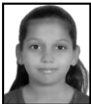
ડાઘા પુષા લલીતભાઈ 7th - 80%