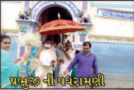
પ્રભુજી ની પધરામણી