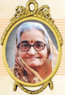
मातुश्री राजनाई लक्ष्मीयंद धारशी मोता

पुण्यब्लोकी मातुश्री जेडीभाई तथा पिताश्री धारशीभाई देवजो मोता