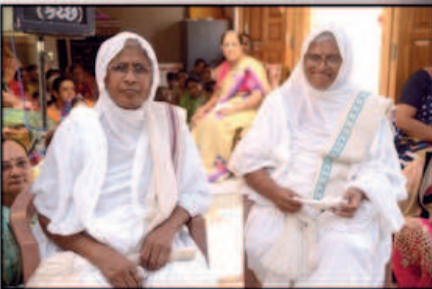
શ્રી નમીઉણ મહાપૂજન