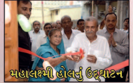
મહાલક્ષ્મી હોલનું ઉદ્ઘાટન