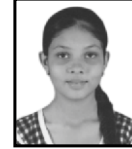
દંડ નિતિકા સંજયભાઈ S.Y.J.C. - 61%