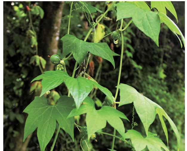
図5 オキナワスズメウリ

トカラ列島以南に分布が知られており、口永良部島からは鹿児島県立博物館（1998）が報告している。本村集落から番屋ヶ峰に至る道路の三差路近くで確認された。口永良部島が分布の北限である。