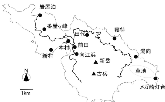
図1 口永良部島地図

口永良部島の植物相については、迫 (1978)、鹿児島県立博物館 (1998)、木戸 (2015) により、140科618種の植物が報告されている。しかし、交通の便の問題もあり十分な調査が行われ植物相の全容が解明されているとは言えない。今回は口永良部島の植物相をより詳細に把握すること、ならびに2015年噴火後の希少種の状況を確認することを目的として調査を行った。なお、調査は入山規制の範囲外である島の北側で主に行った。また、一部、規制範囲内の調査も行ったが、自然度の高いスタジイ林が残されている島の南側については調査できなかった。