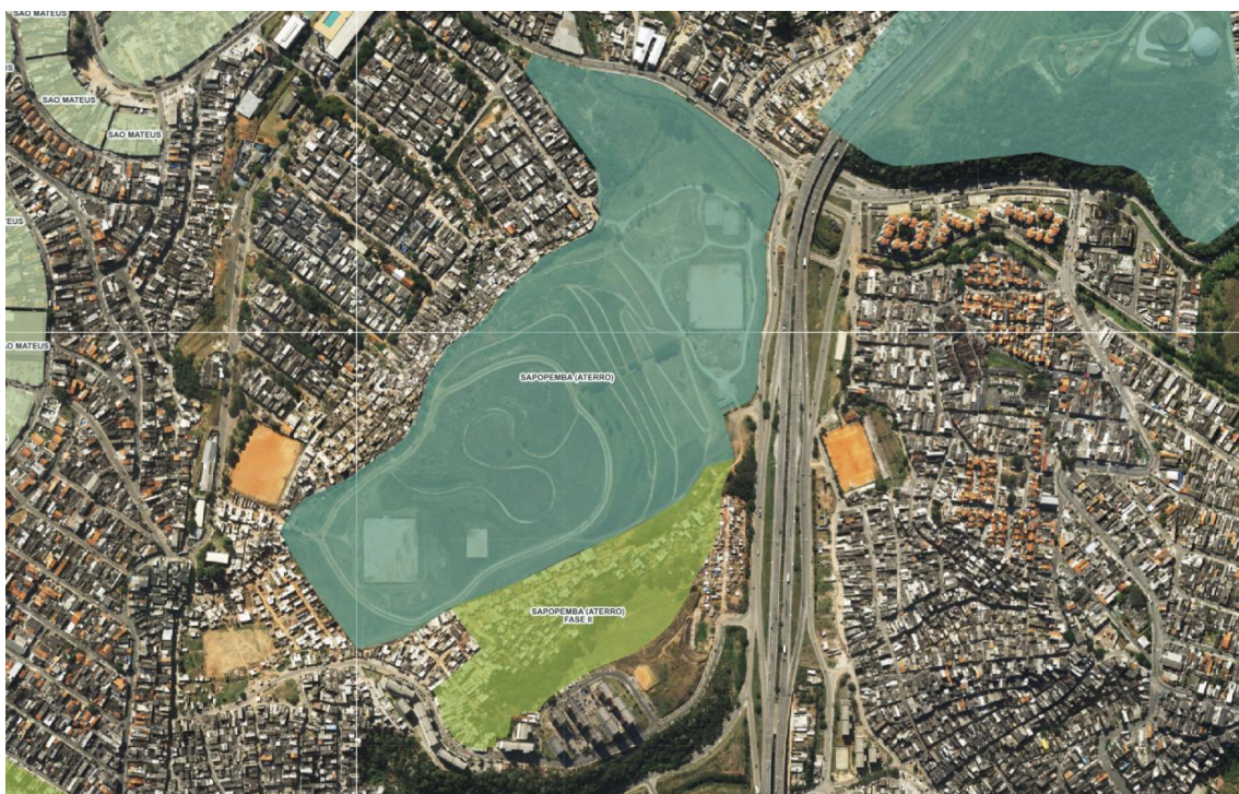
Mapa 2: Ortofoto. Localização do Parque Municipal Aterro Sapopemba.