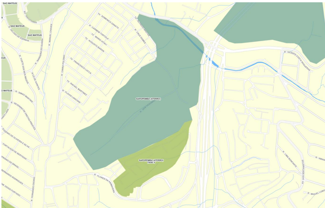
Mapa 1: Político-Administrativo. Localização do Parque Municipal Aterro Sapopemba.