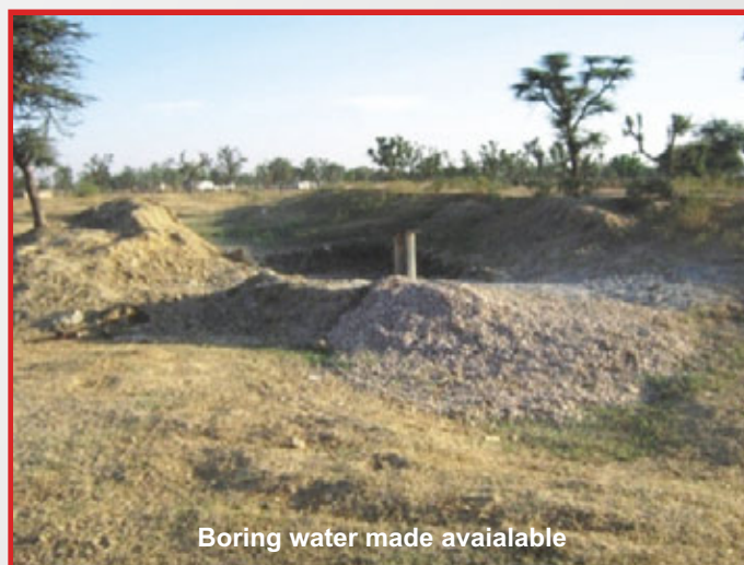
Boring water made available

During health plan preparation at the local level, VHSNC and PRI members initiated the process by identifying the problems of health in general and women health in particular. Finally all the problems were assembled and prioritized at the Panchayat level. The issues of water connection