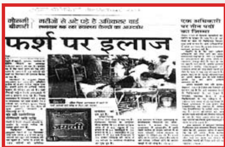
Spread of seasonal diseases in Dausa district

since no preventive action was being taken towards curbing the spread of seasonal diseases, which was bound to happen due to excessive rain. People was unaware about whom to approach timely for taking appropriate action in this regard.