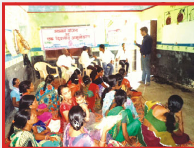
ANM Orientation at Tamatia, Banswara

The problems, their probable solution and responsibilities owned were followed up by PGVS. Sarpanch and other PRI members put this health plan in Panchayat Samiti (PS) for final approval. Just after one month few major problems of Sub centre were resolved with the effort of all -