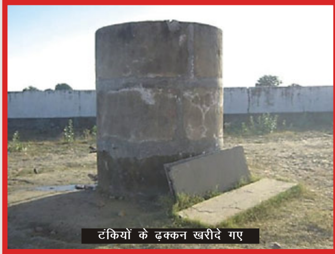
टंकियों के ढक्कन खरीदे गए

पानी की टंकियों के लिए ढक्कन एन आर.एच.एम के अंतर्गत उपलब्ध निर्बन्ध निधि से खरीद लिए गए। पूरे राज्य में इस निधि के अनुपयोग के संदर्भ में यह बिलकुल असामान्य बात है। अब विद्यार्थी भी खुश हैं क्योंकि अब उन्हें गंदा पानी पीने की मजबूरी से