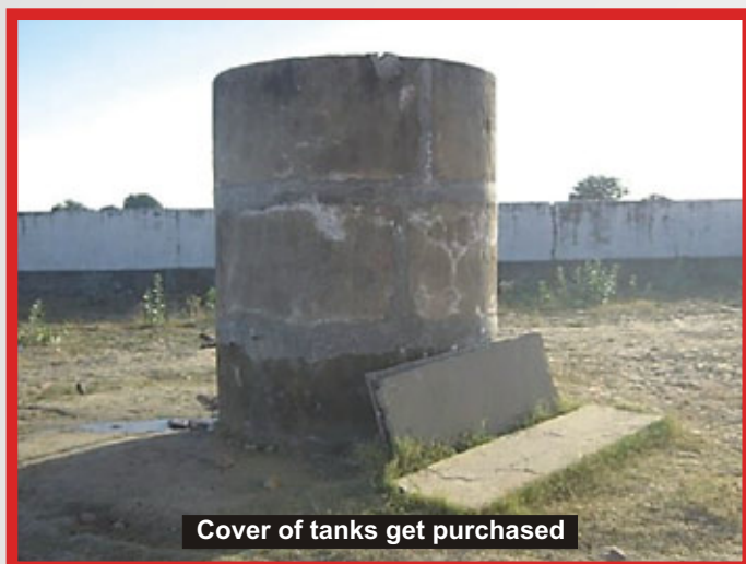
Cover of tanks get purchased