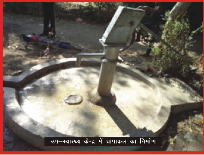
उप-स्वास्थ्य केन्द्र में चापाकल का निर्माण

सभी समस्याओं, उनके संभावित समाधान तथा उनके द्वारा स्वीकार की गयी जिम्मेदारियों की याद नियमित रूप से पी.जी. वी.एस द्वारा दिलायी गयी। उन्होंने सरपंच और अन्य पंचायतों के सदस्यों के साथ भी इसका जायजा लिया। उन्होंने इस स्वास्थ्य योजना को अंतिम मंजूरी के लिए पंचायत समिति (पी एस) में रखा। केवल एक माह बाद ही उप केन्द्र की कुछ प्रमुख समस्याओं का हल सब के प्रयास से कर दिया गया।