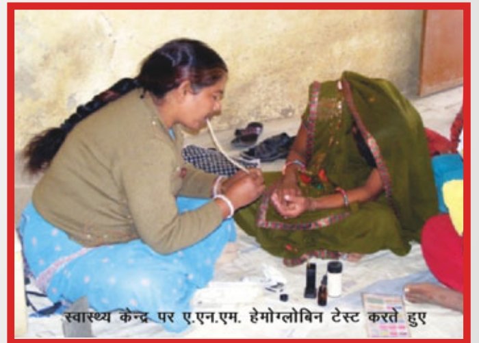
स्वास्थ्य केन्द्र पर ए.एन.एम. हेमोग्लोबिन टेस्ट करते हुए

जी.वी.पी.एस. ने पंचायत के सदस्यों एवं ग्राम स्वास्थ्य स्वच्छता और पोषण समिति (वी. एच.एस.एन.सी) के कुछ सक्रिय सदस्यों की पहल के सहयोग से एक स्वास्थ्य योजना का प्रारूप तैयार किया जिसे अंततः पंचायत बैठक में रखा गया। उस बैठक में गर्भवती महिलाओं तथा किशोरियों में (हिमोग्लोबिन की कमी) एनिमिया का मुद्दा कई लोगों ने उठाया। उन सभी ने