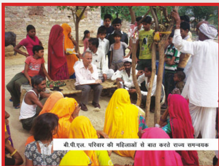
बी.पी.एल. परिवार की महिलाओं से बात करते राज्य समन्वयक

पश्चिमी भारत में राजस्थान का एक जिला है दौसा। सांख्यिकीय आंकड़ों से पता चलता है कि यह क्षेत्रफल की दृष्टि से राजस्थान का सबसे छोटा जिला है। यद्यपि छोटे क्षेत्रफल के बावजूद मौसमी बीमारियों को फैलने से नहीं रोका जा सकता तथा उसे रोकने के लिए बेहतर प्रबंधन नहीं किये जा रहे थे। जुलाई से अगस्त 2012 के दौरान इस जिले में अक्सर होने वाली बरसात वरदान तो थी पर इसके कई अप्रत्याशित दुष्प्रभाव जैसे मौसमी बीमारियां मलेरिया, डेंगू, पीलिया आदि भी साथ आ गए। ज्यादा वर्षा से बाढ़ जैसी स्थिति एवं जल भराव के हालात पैदा हो गए जिससे पानी में ठहराव आ गया एवं कचरा भी जगह जगह जमा हो गया। इन मौसमी रोगों से जिलों में कई मौतें हो रही थीं। इस जिले में एक ही माह के दौरान लगभग 30 लोगों की मौत हो गयी। हालांकि सेंटर फॉर दलित राइट्स द्वारा समय पर की गयी कार्रवाई से एस.जी.आर.पी.आर. कार्यक्रम के अंतर्गत हस्तक्षेप पांच ग्राम पंचायतों में रोगों के प्रसार को रोकने में मदद मिली।