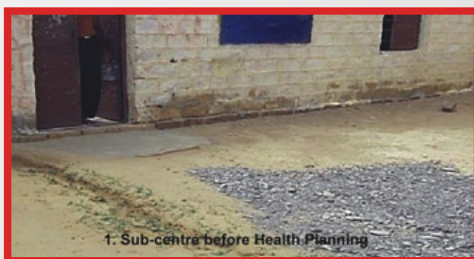
1. Sub-centre before Health Planning

On 2 nd August 2012, in the Panchayat meeting on health planning, various issues like malaria, poor condition of sub-centre and garbage disposal in the village were raised stringently by community and other stakeholders. With proper timeline set for every problem and respective responsibilities of the representatives, a full fledged health plan was prepared by them. ANM Ms Jassi Choudhary vowed to take the issues seriously and utilize untied fund for repairing the sub-centre. It was decided to renovate the sub-centre within one month on priority basis. Similarly Sarpanch also promised to use TFC funds to dispose off the garbage from village. Once the