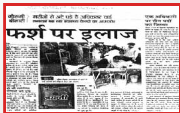
दौसा जिले में मौसमी बीमारियों का प्रकोप

सेंटर फॉर दलित राइट्स राजस्थान के दौसा जिले में मातृत्व स्वास्थ्य एवं लिंग चयन के मुद्दों पर प्रिया एवं यू. एन.एफ.पी.ए. के सहयोग से काम कर रही है। परियोजना के क्रियान्वयन के दौरान, ग्राम पंचायत और वी.एच.एस.एन.सी. के समर्थन से स्वास्थ्य योजना का निर्माण किया गया। मौसमी बीमारियों के फैलने की खबर समुदाय एवं इन साझेदारों द्वारा स्वास्थ्य योजना में उठाई गई। लोग गुस्से में थे क्योंकि मौसमी बीमारियों के फैलने को रोकने की दिशा में कोई निवारक कार्रवाई नहीं की जा रही थी। मौसमी बीमारी तो अत्यधिक वर्षा के कारण फैलनी ही थी। लेकिन लोगों को मालूम नहीं था कि इस संबंध में समय पर समुचित कार्रवाई करने के लिए किससे कहा जाय।