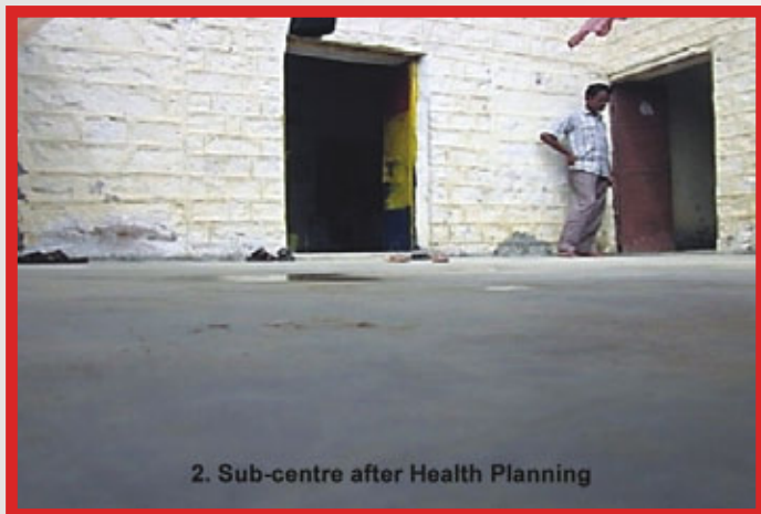
2. Sub-centre after Health Planning

This overhauling of health delivery institution has definitely brought hope among the people in Damodara; however there is still a long way to go for complete reform of health service and efficiency in the systems to deliver responsively.