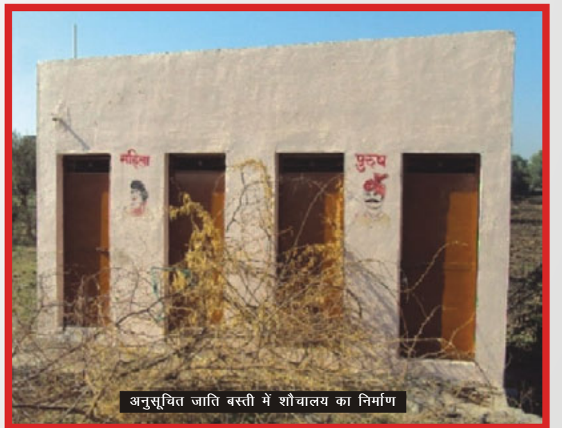
अनुसूचित जाति बस्ती में शौचालय का निर्माण