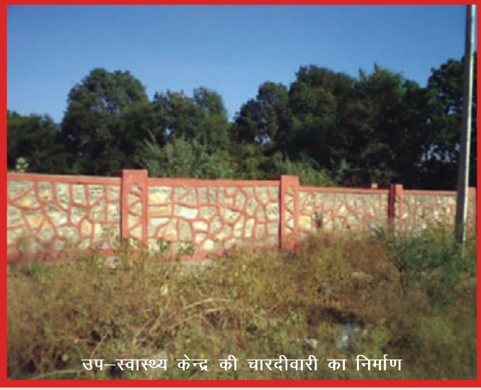
उप-स्वास्थ्य केन्द्र की चारदीवारी का निर्माण

तथा चारदीवारी के निर्माण किए जाने की जरूरत हुई जिसे पंचायत द्वारा पिछड़ा क्षेत्र अनुदान निधि (बी.आर.जी.एफ) से तत्काल कर दिया गया ।