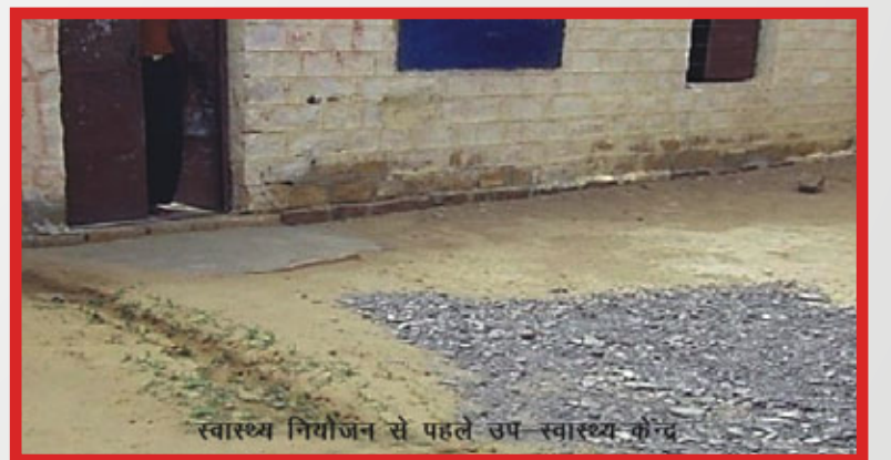
स्वास्थ्य नियोजन से पहले उप-स्वास्थ्य केन्द्र