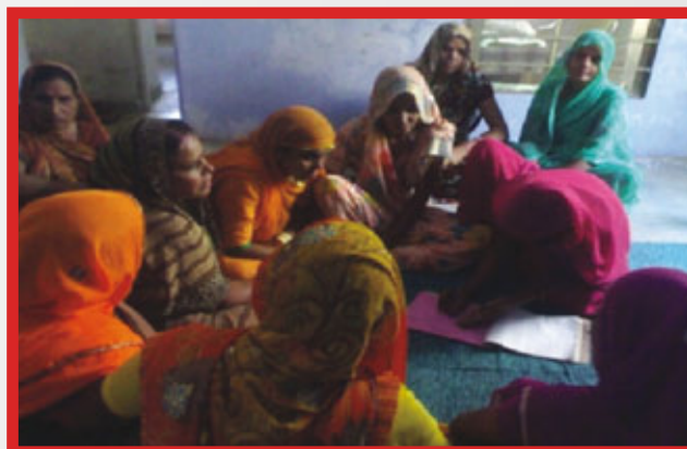
List of VHSNC Members