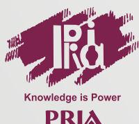
Letter by CDR organisation to Health Officers

42, Tughlakabad Institutional Area, New Delhi - 110 062 Tel. : +91-11-2996 0931-33 Fax : +91-11-2995 5183 E-mail : info@pria.org Website : www.pria.org