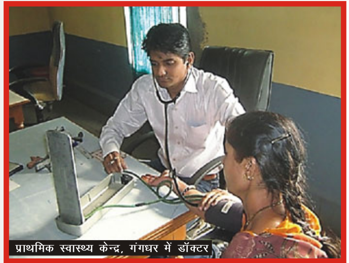
प्राथमिक स्वास्थ्य केन्द्र, गंगधर में डॉक्टर

अंतर्गत प्रत्येक गांव पर समुचित ध्यान दिया जा रहा है तथा यदि जरूरत पड़े तो रेफर भी किया जा रहा है। सुरक्षित संस्थागत प्रसव अब रोजमर्रा की बात हो गयी है। गांव वाले चिकित्सा अधिकारी एवं चिकित्साकर्मियों के रुख से बहुत खुश हैं क्योंकि उनके लोग सुरक्षित माहौल में जी सकते हैं तथा वे लोगों को जागरूक करने में तत्कालीन स्वास्थ्य योजना को नहीं भूलते हैं।