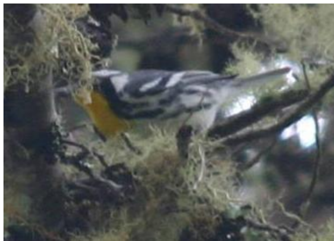
Figure 1: Dendroica dominica at Reserva Natural El Dorado, 20 February 2009 (Deb Hahn).

On 4 November 2007 Trevor Ellery observed an adult Yellow-throated Warbler Dendroica dominica at Reserva Natural de Aves El Dorado, San Lorenzo ridge, Sierra Nevada de Santa Marta, Magdalena, Colombia at the border between a Mexican Pine Pinus patula plantation and native forest in a mixed species flock including Black-throated Green-Warbler Dendroica virens . The locality is on the main road that runs through the reserve, c. 3 km by road above the reserve centre (11.06°41.23'N 74.03° 33.45'W, 2,210 m). Unaware of the previous observation, Thomas Donegan observed the same species, and presumably the same individual, at the very same spot at c. 14:00 hrs on 3 January 2009 in a flock together with Slate-throated Whitestart Myioborus miniatus and Blackburnian Warbler D. fusca .