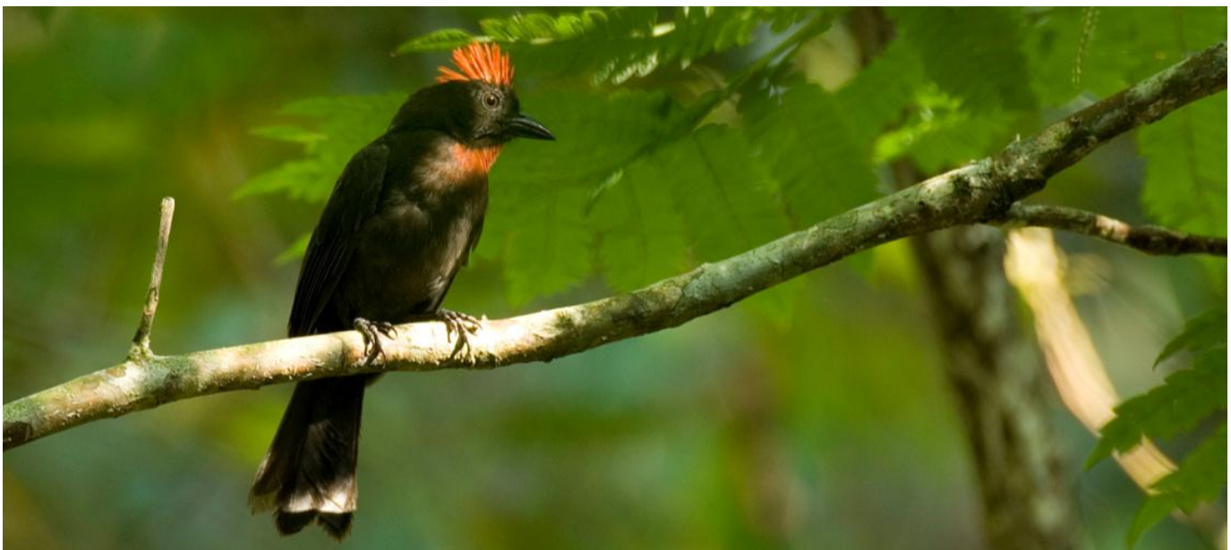
Habia Ceniza / Sooty Ant-Tanager Habia gutturalis at Reserva Natural de las Aves El Paujil by Murray Cooper.