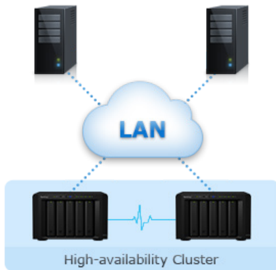
Abbildung 1) Zuverlässigkeit, Verfügbarkeit & Disaster Recovery

Synology High Availability stellt bei Ausfall eines Servers den nahtlosen Wechsel zwischen zwei Cluster-Servern mit minimalen Auswirkungen auf Unternehmen sicher.