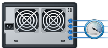
Abbildung 2) Herausragende Leistung

Synology High Availability stellt bei Ausfall eines Servers den nahtlosen Wechsel zwischen zwei Cluster-Servern mit minimalen Auswirkungen auf Unternehmen sicher.