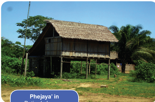
Phejaya' in Patio de la casa