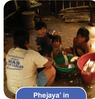
Phejaya' in Patio de la casa

Observa las plantas medicinales de tu patio y dibújalas.