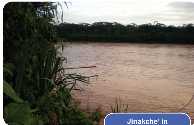
Jinakche' in Arroyos y ríos