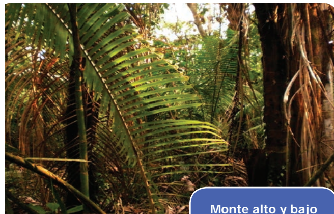
Monte alto y bajo