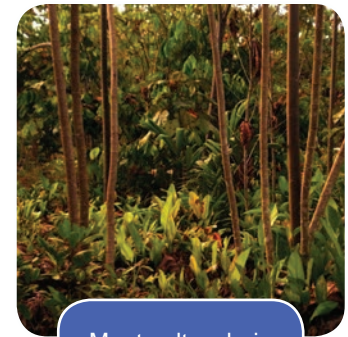
Monte alto y bajo