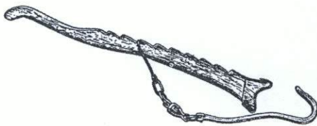
Fig. 804 : appareil à levier pour rapprocher les perches à lier dans une haie, crama d' cloyéû . José-Battice. (Pays de Herve).

levier lèvi ; haminde en fer, fig. 326; djisse en bois (Stav., Lierneux...); ringuèl , f. (Verv., Malm.); tin-caue (Verv., Jalhay); petit ~ édè (F; Sprimont); indè H; Jehay, Trembleur); soulever à l'aide du ~ djîster , fé 'ne djisse , voy. PESÉE; ~ pour soulever une roue gade , f.; polin (Marchin); ~ pour serrer la