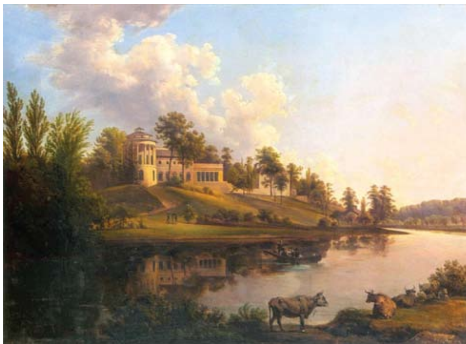
Ryc. 4. Zarzecze , obraz olejny Jana N. Głowackiego (1830), Lwowska Galeria Obrazów, za Sołtysówną (2004).