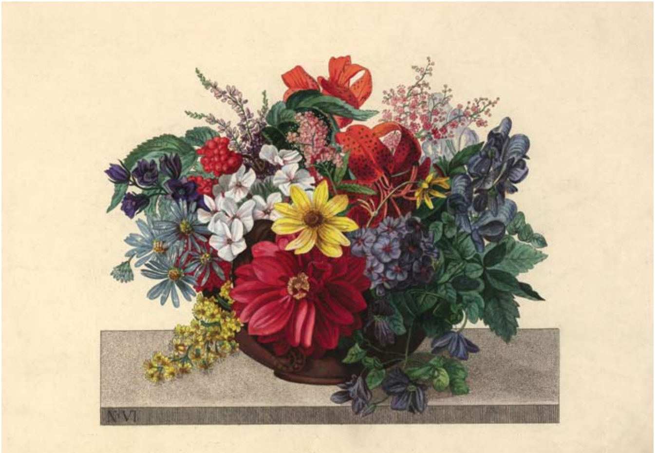
Ryc. 6. Spiraea salicifolia i Spiraea alba (lub nawet S. ×rosalba ?) w Bukiecie VI (od 15 do 30 lipca) (Morska 1836). W zbiorach Centralnej Biblioteki Rolniczej, sygn. NZB-DD 48628.