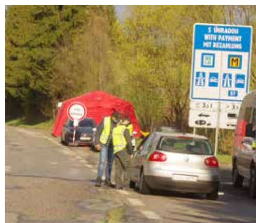
Dôslednej kontrole v Lysej pod Makytou sa nevyhne posádka žiadneho automobilu.