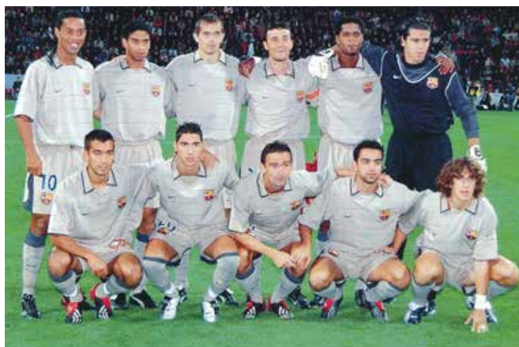
Mužstvo Barcelony pred stretnutím v Trnave.

Matador Púchov – Sioni Bolnisi 3:0 (0:0)