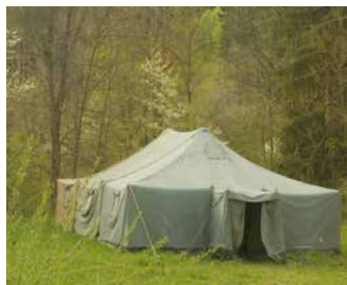
Vojenský stan pre repatriantov bol v sobotu prázdny.

Uvoľnenie opatrení na hraniciach sa týkajú aj vodičov nákladných automobilov, študentov a ďalších osôb, nariadenie hygienika presne určuje podmienky. Nariadenie je zverejnené aj webovej stránke ministerstva vnútra SR. (r)