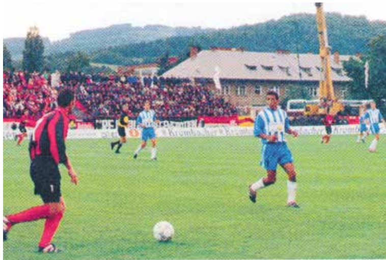
Obrázok zo stretnutia potvrdzuje nebývalý záujem divákov a tiež jeden z prenosných nosičov umelého osvetlenia.

V prvom prípade Malta, pri druhom štarte Kazachstan a nakoniec súper z Gruzínska. Napriek stúpajúcej úrovni futbalu v týchto krajinách bol postup do hlavnej súťaže vo všetkých troch prípadoch pomerne jednoznačný. V prvom kole to už boli atraktívni súper z futbalovo vyspelejších krajín. Cez tých sa už futbalisti Matadoru do ďalšieho kola nedostali.