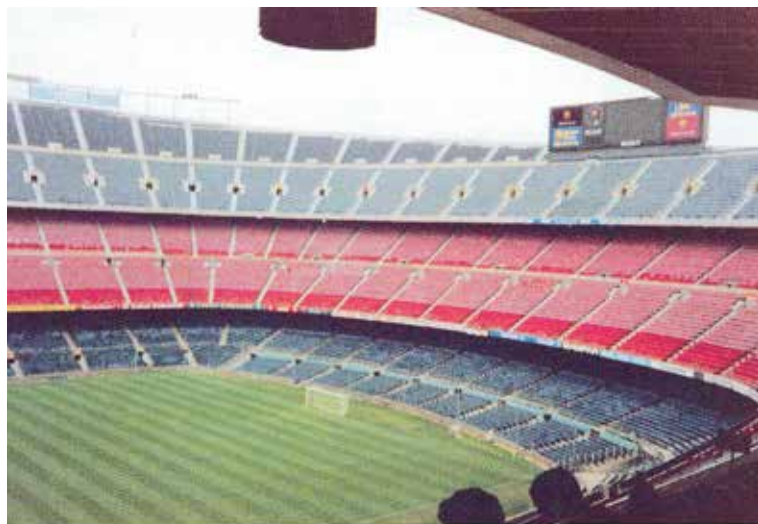
Štadión NOU CAMP v Barcelone bol dejiskom odveti POHÁRA UEFA dňa 16. 10. 2003. Jeho kapacita je 90 000 divákov. Na Púchov ich bolo zvedavých 29 700.