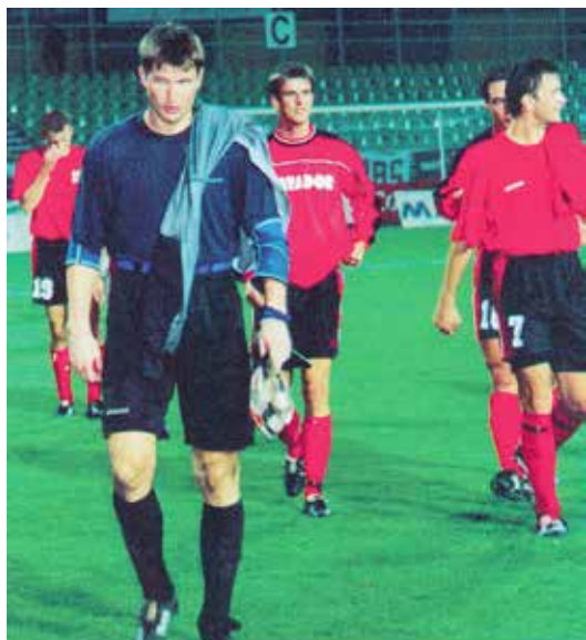
Dávkou zo štadióna v Žiline po prehre 1:4 skončilo účinkovanie Matadoru v tomto ročníku POHÁRA UEFA.

2001 sa zapísalo hned dvomi mimoriadnymi udalosťami. Hralo sa pri umelom osvetlení, ktoré nainštalovali len pre túto príležitosť (požiadavka televízneho prenosu do Nemecka). Druhou udalosťou, ktorá televízny prenos skomplikovala, bol teroristický útok na „dvojičky“ – mrakodrapy Svetového obchodného centra v New Yorku. Nerozhodný výsledok proti účastníkovi bundesligy dával šancu do odvety. Tú Matador dlho držal na svojej strane, a tak o postupe favorita rozhodol až nešťastný gól v záverečnej