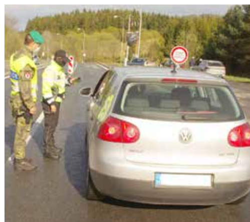
Rovnako dôsledná je aj česká polícia a armáda...