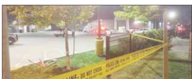
ਵਿੱਚ ਪਹੁੰਚੇ ਤਾਂ ਉਥੇ ਉਨ੍ਹਾਂ ਨੂੰ ਇਹ ਤਿੰਨੇ ਵਿਅਕਤੀ ਜ਼ਖ਼ਮੀ ਹਾਲਤ ਵਿੱਚ ਮਿਲੇ। ਪੁਲਿਸ ਨੂੰ ਇਸ ਇਲਾਕੇ ਵਿੱਚੋਂ ਗੋਲੀਆਂ ਦੇ ਕਈ ਖੋਲ ਵੀ ਮਿਲੇ ਹਨ। ਪਰ ਅਜੇ ਤੱਕ ਮਸ਼ਕੂਕ ਬਾਰੇ ਪੁਲਿਸ ਵੱਲੋਂ ਕੋਈ ਜਾਣਕਾਰੀ ਜਾਰੀ ਨਹੀਂ ਕੀਤੀ ਗਈ।

ਟੋਰਾਂਟੋ, 13 ਅਕਤੂਬਰ (ਪੋਸਟ ਬਿਊਰੋ) : ਨੌਰਥ ਯੌਰਕ ਵਿੱਚ ਵਾਪਰੇ ਤੀਹਰੇ ਗੋਲੀਕਾਂਡ ਵਿੱਚ ਤਿੰਨ ਵਿਅਕਤੀ ਜ਼ਖ਼ਮੀ ਹੋ ਗਏ। ਇਨ੍ਹਾਂ ਤਿੰਨਾਂ ਵਿਅਕਤੀਆਂ ਦੀ ਹਾਲਤ ਗੰਭੀਰ ਤੌਰ 'ਤੇ ਨੌਰਥ ਯੌਰਕ ਤੱਕ ਹੈ। ਪੁਲਿਸ ਨੇ ਦੱਸਿਆ ਕਿ ਐਤਵਾਰ ਰਾਤ ਨੂੰ ਕਈ ਗੋਲੀਆਂ ਚੱਲਣ ਦੀਆਂ ਖਬਰਾਂ ਮਿਲਣ ਤੋਂ ਬਾਅਦ ਜਦੋਂ ਉਹ ਫਿੱਚ ਐਵੇਨਿਊ ਵੈਸਟ ਤੇ ਆਲਨੈੱਸ ਸਟਰੀਟ ਏਰੀਆ