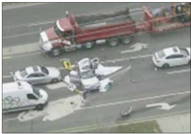
ਵਜੇ ਤੋਂ ਠੀਕ ਬਾਅਦ ਮਾਰਖਮ ਰੋਡ ਤੇ ਐਲਸਨ ਸਟਰੀਟ ਦੇ ਕੋਨੇ ਵਿੱਚ ਵਾਪਰਿਆ। ਅਜੇ ਤੱਕ ਇਹ ਪਤਾ ਨਹੀਂ ਲੱਗ ਸਕਿਆ ਹੈ ਕਿ ਹਾਦਸਾ ਕਿਉਂ ਵਾਪਰਿਆ ਤੇ ਇਹ ਵੀ ਪਤਾ ਨਹੀਂ ਲੱਗ ਸਕਿਆ ਕਿ ਕਿਸੇ ਖਿਲਾਫ ਕੋਈ ਚਾਰਜਜ਼ ਪੈਂਡਿੰਗ ਹਨ ਜਾਂ ਨਹੀਂ।

ਮਾਰਖਮ, 13 ਅਕਤੂਬਰ (ਪੋਸਟ ਬਿਊਰੋ) : ਬੁੱਧਵਾਰ ਦੁਪਹਿਰ ਨੂੰ ਮਾਰਖਮ ਵਿੱਚ ਇੱਕ ਡੀਪ ਟਰੱਕ ਤੇ ਕਾਰ ਦਰਮਿਆਨ ਹੋਏ ਹਾਦਸੇ ਵਿੱਚ ਦੋ ਵਿਅਕਤੀ ਮਾਰੇ ਗਏ ਜਦਕਿ ਇੱਕ ਗੰਭੀਰ ਰੂਪ ਵਿੱਚ ਜ਼ਖ਼ਮੀ ਹੋ ਗਿਆ। ਇਸ ਦੀ ਪੁਸ਼ਟੀ ਯੋਕ ਰੀਜਨਲ ਪੁਲਿਸ ਵੱਲੋਂ ਕੀਤੀ ਗਈ।