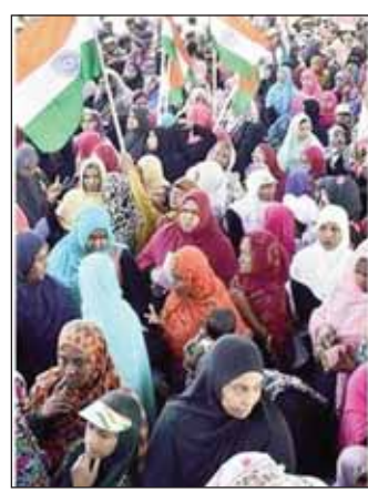
ਕਰਨ ਜਾਣ ਲਈ ਕਿਸੇ ਨੂੰ ਨਿਯੁਕਤ ਕੀਤਾ ਜਾ ਸਕਦਾ ਹੈ। ਇਸ ਮੌਕੇ ਕੋਰਟ ਨੇ ਕਿਹਾ ਕਿ ਸੀਨੀਅਰ

ਨਵੀਂ ਦਿੱਲੀ, 17 ਫਰਵਰੀ, (ਪੋਸਟ ਬਿਊਰੋ)- ਨਾਗਰਿਕਤਾ ਸੋਧ ਕਾਨੂੰਨ (ਸੀ ਏ ਏ) ਦੇ ਵਿਰੁੱਧ ਦਿੱਲੀ ਦੇ ਸ਼ਾਹੀਨ ਬਾਗ ਵਿੱਚ ਬੀਤੇ ਦੋ ਮਹੀਨਿਆਂ ਤੋਂ ਚੱਲਦੇ ਪ੍ਰਦਰਸ਼ਨ ਬਾਰੇ ਅੱਜ ਸੁਪਰੀਮ ਕੋਰਟ ਵਿੱਚ ਦੌਰਾਨ ਕੋਰਟ ਨੇ ਰੋਸ ਪ੍ਰਦਰਸ਼ਨ ਕਰ ਰਹੇ ਲੋਕਾਂ ਦਾ ਪੱਖ ਜਾਣਨ ਲਈ ਦੋ ਵਾਰਤਾਕਾਰ ਨਿਯੁਕਤ ਕਰਨ ਦੇ ਆਦੇਸ਼ ਦਿੱਤੇ ਹਨ। ਅੱਜ ਦੀ ਸੁਣਵਾਈ ਦੌਰਾਨ ਸੁਪਰੀਮ ਕੋਰਟ ਨੇ ਪੁੱਛਿਆ ਕਿ ਨਾਗਰਿਕ ਸੋਧ ਕਾਨੂੰਨ ਦੇ ਵਿਰੁੱਧ ਰੋਸ ਸ਼ਾਹੀਨ ਬਾਗ ਵਿੱਚ ਪ੍ਰਦਰਸ਼ਨ ਕਰਦੇ ਲੋਕਾਂ ਨਾਲ ਗੱਲ ਕਰਨ ਜਾਂ ਗੱਲਬਾਤ