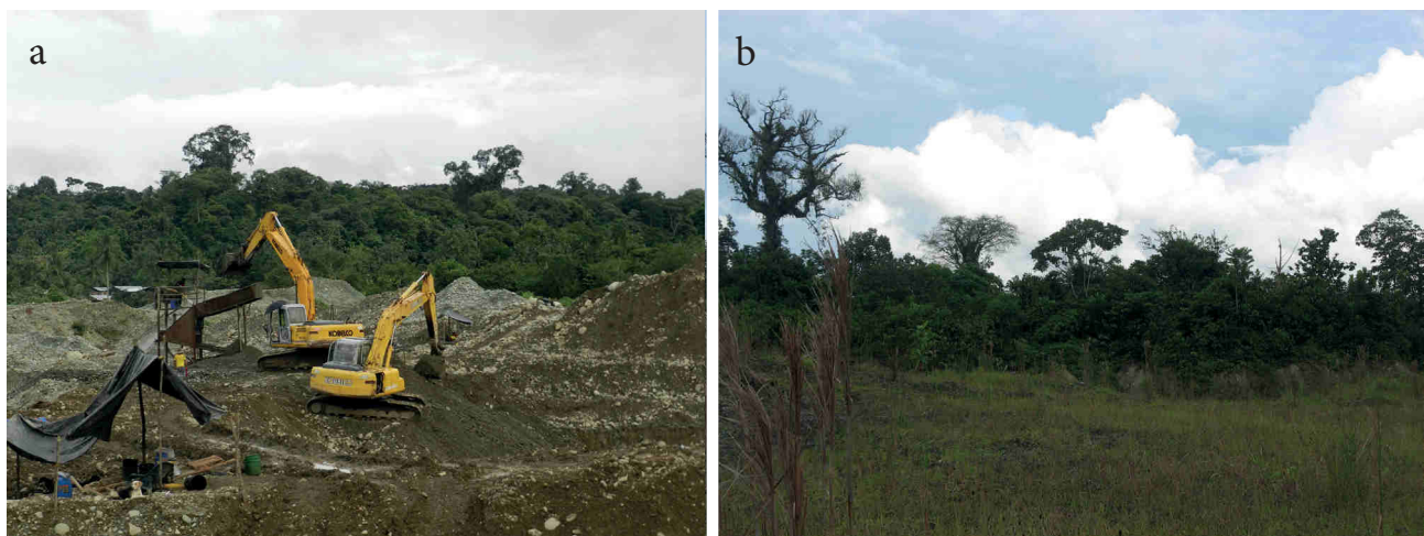
Figura 2. Minería a cielo abierto en el Chocó, Colombia: a) impactos generados por la actividad minera realizada con retroexcavadoras en el seno de los sistemas forestales naturales y b) capacidad de regeneración natural de los sistemas afectados.

En las minas seleccionadas se realizaron colecciones generales de las morfo-especies de plantas vasculares que caracterizan a estos sistemas durante dos años (entre marzo de 2012 y marzo de 2014), tomando nota de su hábito de crecimiento (herbáceo, arbustivo o arbóreo) y el sitio de la mina (hábitat) donde estas se encontraban creciendo (ecotono, taludes,