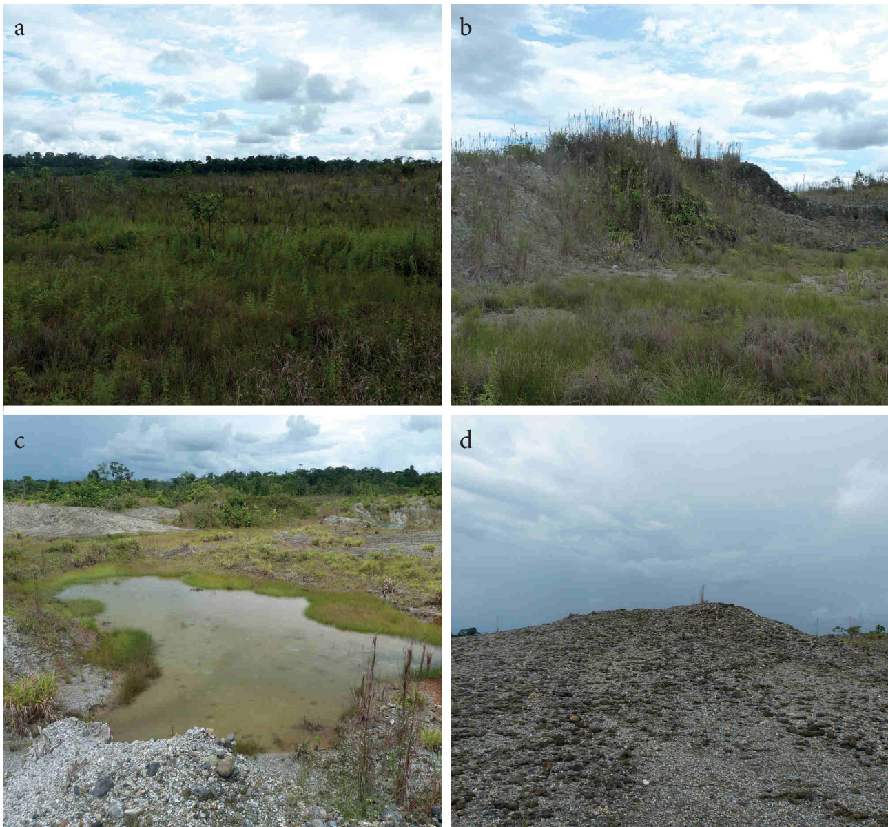
Figura 3. Principales formaciones topográficas resultantes de las labores de minería a cielo abierto en bosques naturales del Chocó, Colombia: a) zonas planas no inundables, b) taludes de pendiente fuerte, c) depresiones cenagosas o zonas pantanosas y d) montículos de arena y grava.

(Gentry 1996, Mahecha 1997), por confrontación con ejemplares depositados en los herbarios CHOCÓ de la Universidad Tecnológica del Chocó, Colecciones Científicas en Línea de la Universidad Nacional de Colombia con sede en Bogotá ( http://www.biovirtual.unal.edu.co/ICN/ ), Tropic del Missouri Botanical Garden ( http://www.tropicos.org ) y Virtual Herbarium del New York Botanical Garden ( http://www.nybg.org ).