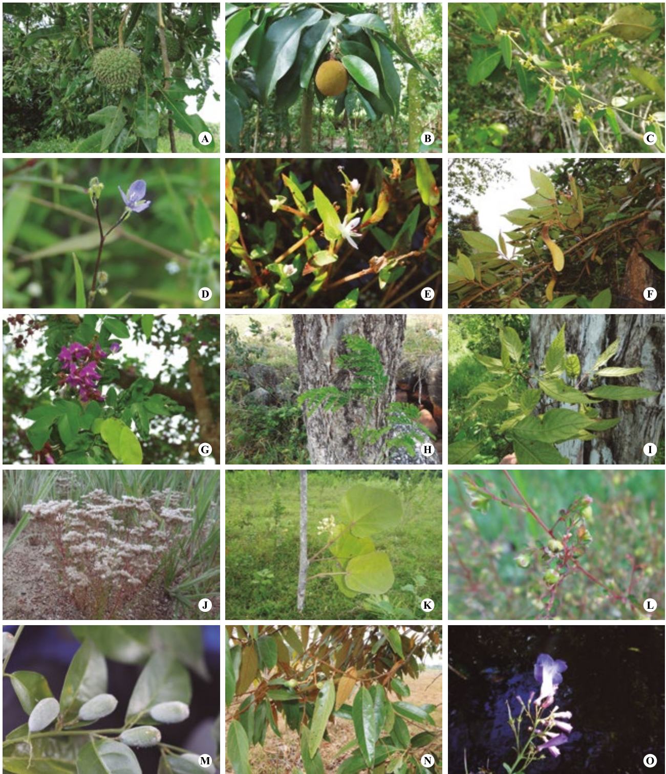
Figura 2. Fotografías de los nuevos registros para la flora vascular de Colombia, recolectadas en la Orinoquía, departamento de Arauca. A) D. riberensis , B) T. duckei , C) T. medinae , D) M. burchellii , E) Murdannia aff. M. triquetra , F) M. tovarense , G) M. crucisrubierae , H) E. barinense , I) C. aromatica , J) P. corymbosa var. brasiliensis K) C. africana , L) P. microphyllus , M) D. cyanocarpa N) N. bartlettiana , O) J. orinocensis .