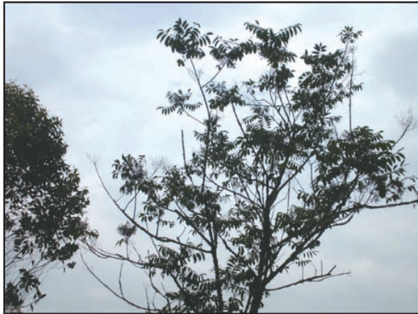
Figura 3. El árbol Toxicodendron striatum “manzanillo” mide unos 4 o 5 metros de alto.