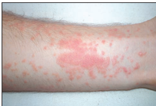
Figura 1. Lesión eritematosa, con vesiculación.

A la familia anacardiaceae pertenecen otras especies de amplia difusión en América Latina como el marañón y el mango. El mango ( Mangifera indica ) contiene pequeñas cantidades de oleorresinas relacionadas con el urushiol y puede producir, en personas sensibilizadas, eczemas peribucales o lesiones en las mucosas de la boca o del sistema gastrointestinal, por el contacto directo (5). El marañón, Anacardium occidentale , también llamado merey, alcayoiba,