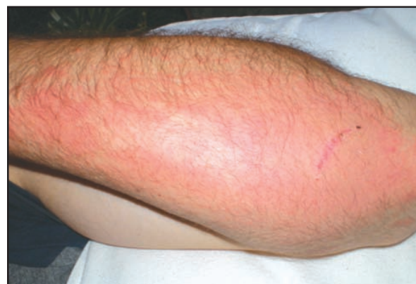
Figura 2. Las lesiones comprometen zonas donde no hubo contacto directo.