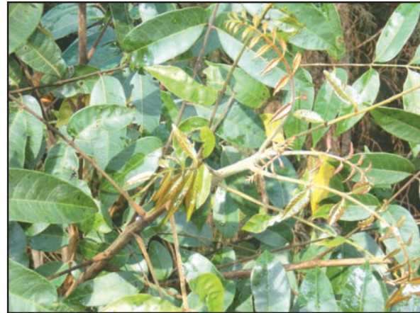
Figura 4. Hojas del árbol “manzanillo”.