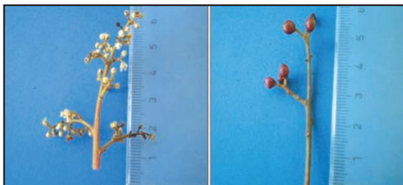
Figura 5. Flores y frutos del “manzanillo”.