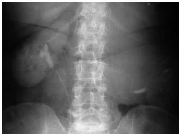
FIGURA 1. UIV en la que se aprecia desplazamiento pielocalicial izquierdo.

Presentamos una paciente de 63 años de edad, con antecedentes de hipertensión arterial y angor pectoris, remitida a nuestro servicio desde un hospital de un medio rural. El motivo de la consulta era el hallazgo casual en una ecografía de una masa renal izquierda, no refiriendo la paciente sintomatología alguna. En la analítica de sangre sólo aparecía una discreta eosinofilia. Como estudios complementarios se realizaron urografías intravenosas en las que se observó un efecto masa a nivel de flanco izquierdo, de borde liso y bien delimitado, dependiente del polo superior del riñón izquierdo, con compresión extrínseca del sistema pielocalicial, de 16 x