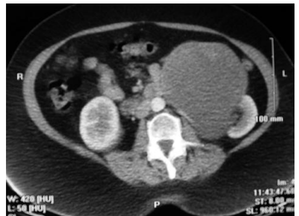
FIGURA 2. TAC. Gran masa renal izquierda.