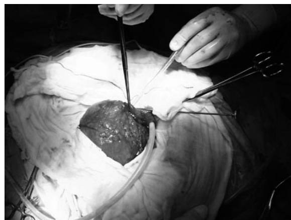
FIGURA 4. Protección del campo mediante compresas bañadas en rivanol.