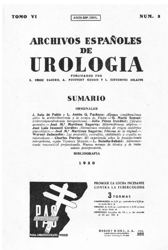
FIGURA 3. Portada de Archivos Españoles en su primera época.

abril, con lo que se ultima y se completa el volumen uno. El dos principia en julio de 1945, celebran los fundadores su primer año con un editorial Con intensa satisfacción, agradecemos la cordial acogida de parada a la publicación dentro y fuera de España... , prosigue con el correspondiente a octubre para pasar a enero y abril de 1946, esquema que se continuará hasta abril de 1949, con el quinto (T-V). En 1949 no se edita en los meses de julio y octubre y, a partir de 1950, con el T-VI, la secuencia comienza en enero y, sucesivamente, los de abril, julio y octubre, con lo que se logra que los cuatro números de cada año estén incluidos en un mismo volumen (Tabla I).