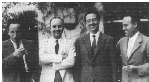
FIGURA 1. Los promotores de la publicación reunidos en la comida de celebración de la aparición del primer número en 1944.

En julio de 1944 sale a la luz el primer número, le seguirá el segundo en el mes de octubre, el siguiente en enero de 1945 y el cuarto en el mes de