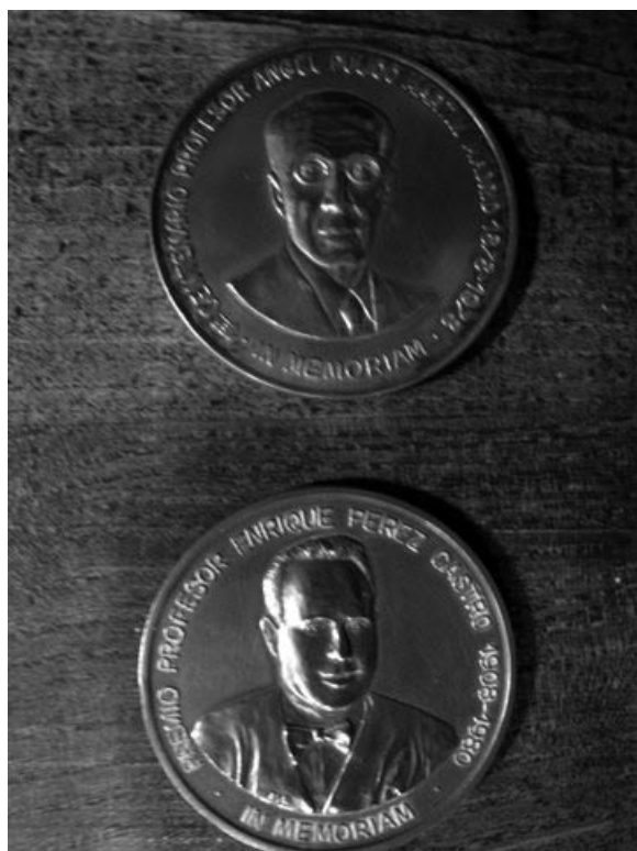
FIGURA 5. Medalla al mejor trabajo publicado en el año. Premio Dr. Pulido entre 1967 y 1980 y Pérez Castro desde 1981 hasta la actualidad.

El primer número del T-I presenta cinco artículos originales, lo inicia un gran maestro de la Urología portuguesa, Reinaldo dos Santos, y otro de la española, Pedro Cifuentes Díaz, seguido de un trabajo de cada uno de los promotores, junto con dos casos clínicos y una amplia reseña bibliográfica de los aparecidos en otras publicaciones, recensiones que seguirán a lo largo de los años, efectuadas por numerosos colaboradores, por lo general ayudantes y asistentes a los servicios de los promotores (Tabla II), además de noticias variadas. En el segundo, otros seis artículos y otros dos casos de patologías, el resumen de los libros de temas urológicos editados por los autores españoles en los últimos años y también los de los argentinos. No consideramos necesario extendernos en pormenorizar con meticulosidad la