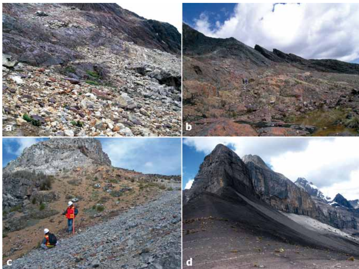
Figura 2. Localidades de estudio: a) Punta Olímpica (Chacas - Asunción). b) Abra de Cabuish (Recuay). c) Antamina (San Marcos - Huari)

De las 136 especies registradas, 76 (56,29%) están presentes en los suelos crioturbados y muchos de ellos también en la vegetación asociada. Pero solamente cuatro especies (5,26%) han sido registradas solamente sobre suelos crioturbados. Estas especies son: Stangea henrici Graebn., Xenophyllum decorum (S.F.