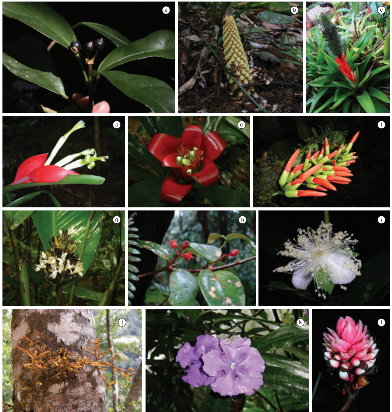
Figura 2. Algumas espécies ocorrentes no interior do Parque Estadual Carlos Botelho. a) Dendropanax australis (Araliaceae). b) Lophophytum leandrii (Balanophoraceae). c) Aechmea ornata (Bromeliaceae). d) Billbergia amoena (Bromeliaceae). e) Nidularium amazonicum (Bromeliaceae). f) Dahlstedtia pinnata (Fabaceae). g) Calathea monophylla (Marantaceae). h) Pleiochiton blepharodes (Melastomataceae). i) Eugenia bocainensis (Myrtaceae). j) Phoradendron fragile (Santalaceae). k) Brunfelsia pauciflora (Solanaceae). l) Renalmia petasites (Zingiberaceae).