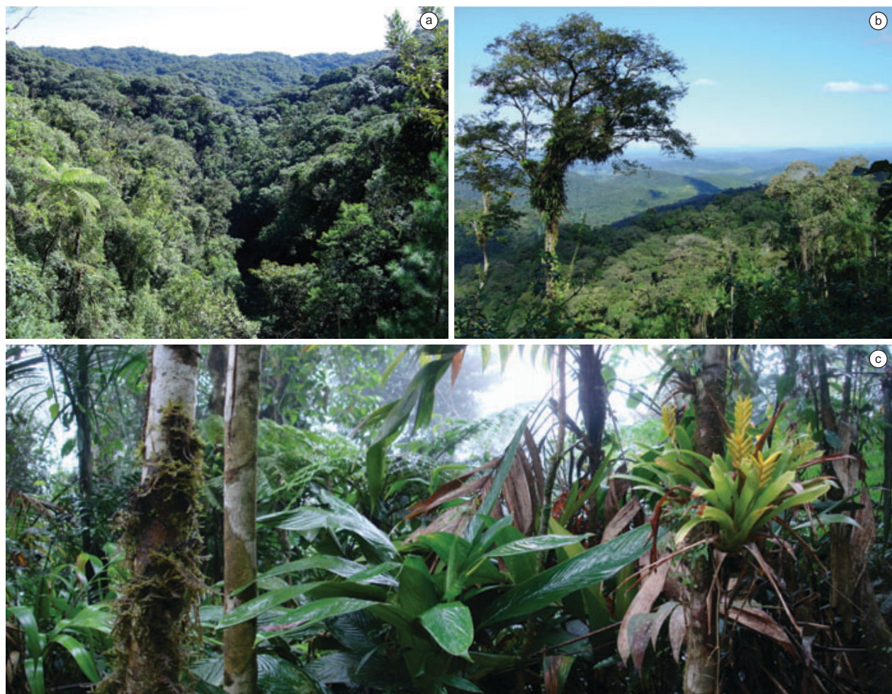
Figura 1. As duas principais fitofisionomias ocorrentes no Parque Estadual Carlos Botelho, São Paulo, Brasil. a) Floresta Ombrófila Densa Montana. b) Floresta Ombrófila Densa Submontana. c) vista interna da Floresta Ombrófila Densa Submontana.