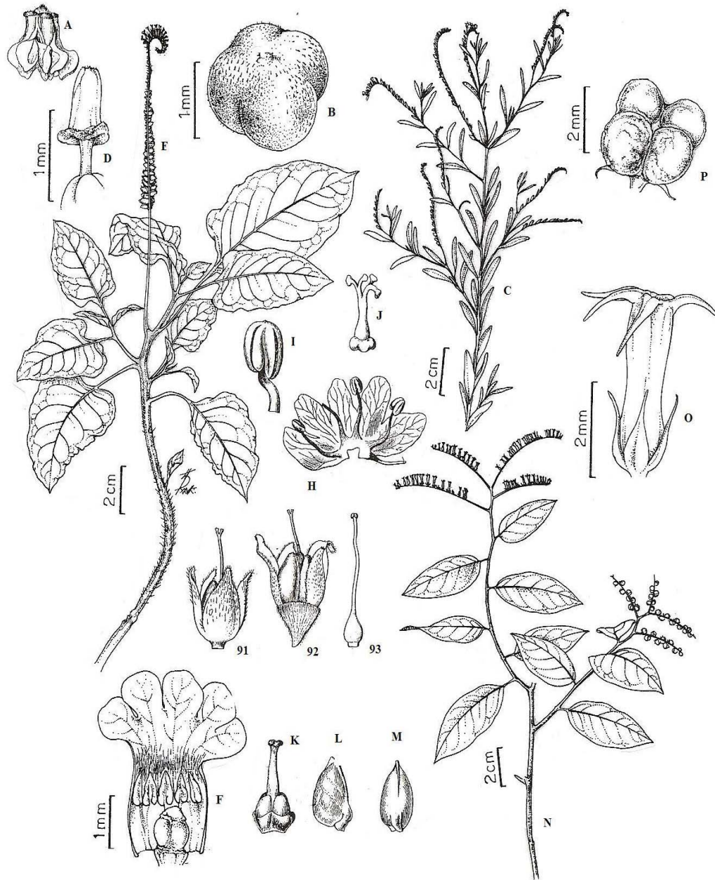
Figura 2. A. Euploca paradoxa : androceu. B. Euploca salicoides : fruto. C. Euploca filiforme : ramo reprodutivo. D. Heliotropium arborescens : gineceu, evidenciando estilete e estigma. E. Heliotropium elongatum : ramo reprodutivo. F. Heliotropium angiospermum : corola rebatida, evidenciando androceu e gineceu. G. Moritzia ciliata : g 1 , cálice e estigmas; g 2 , fruto; g 3 , gineceu. H-J. Patagonula americana : H. Corola rebatida, evidenciando androceu; I. Estame; J. Gineceu; K-M. Rotula lycioides : K. Gineceu; L. Fruto, em vista frontal. M. Fruto, em vista lateral. N-P. Myriopola salzmannii : N. Ramo reprodutivo; O. Flor; P. Fruto, em vista superior.