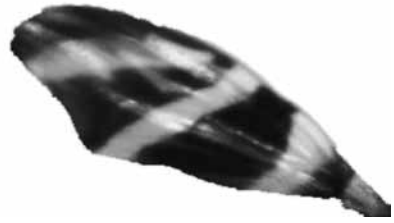
Figs. 1-2. Ala y adulto de Euxesta eluta .