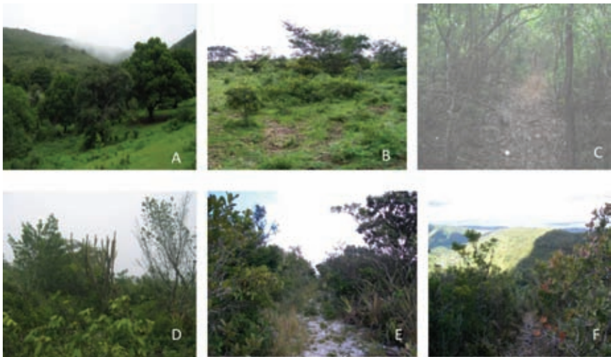
Figura 3 - Sequência de fotos. Legenda: A) Representação da fisionomia do 'ponto 1', base da encosta; B) 'ponto 2', meia encosta; C) 'ponto 3', meia encosta em área de mata; D) 'ponto 4', borda da mancha de cerrado; E) e F) 'ponto 5', topo da encosta. Fotos: Linaldo Santos, 2009.

Fonte: Elaborado por Linaldo Santos, 2010.