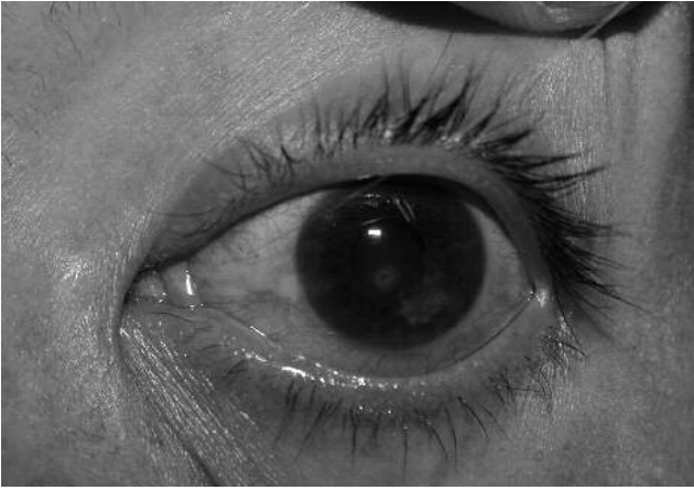
Fig. 1. Queratitis ulcerativa de bordes plumosos y lesiones satélites, inyección conjuntival leve, 3 días de evolución.

Eventualmente, pueden presentarse múltiples infiltrados satélites, ubicados en el extremo profundo del estroma, acompañada de una placa endotelial y de hipopión. La invasión de las hifas a la cámara anterior puede producirse a través de la membrana de Descemet incluso estando intacta (13) (Fig 2 y 3).