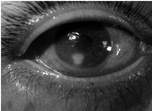
Fig. 2. Queratitis ulcerativa de bordes plumosos, reacción inflamatoria en la cámara anterior, 5 días de evolución.

Eventualmente, pueden presentarse múltiples infiltrados satélites, ubicados en el extremo profundo del estroma, acompañada de una placa endotelial y de hipopión. La invasión de las hifas a la cámara anterior puede producirse a través de la membrana de Descemet incluso estando intacta (13) (Fig 2 y 3).