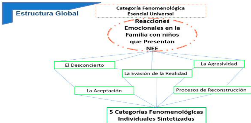
Gráfico 2. Estructura Global: Reacciones emocionales en la familia con niños que presentan Necesidades Educativas Especiales. (NEE elaborado por la autora, 2016).

más elevado que lo fáctico; sobre la base del contenido representado en el cuadro 2 que fue construido a partir de la aplicación de los pasos constitutivos del método fenomenológico y contrastado con los aportes de videos sobre testimonios de vivencias de familias con niños que presentan NEE, a nivel nacional e internacional, contemplando la fisonomía constituida en la estructura global, denominada para este estudio: Reacciones Emocionales en la familia con niños que presentan NEE (ver gráfico 2).