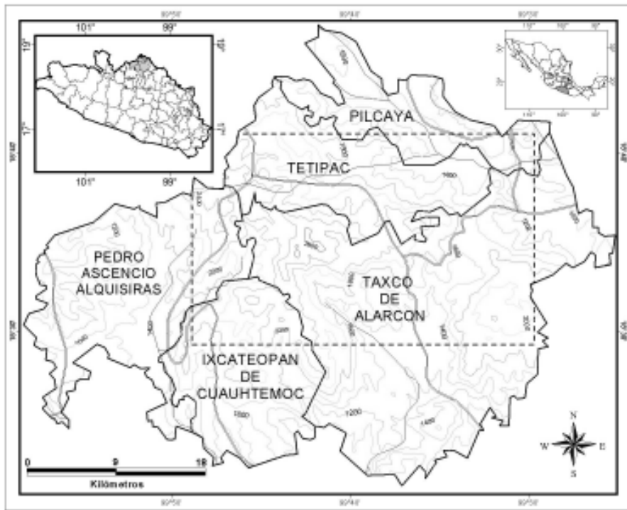
Fig. 1. Localización de la zona de estudio.

En su parte más alta alcanza alturas superiores a los 2 500 m y es allí donde se originan las cadenas montañosas que en la vertiente interior se dirigen al río Bal-