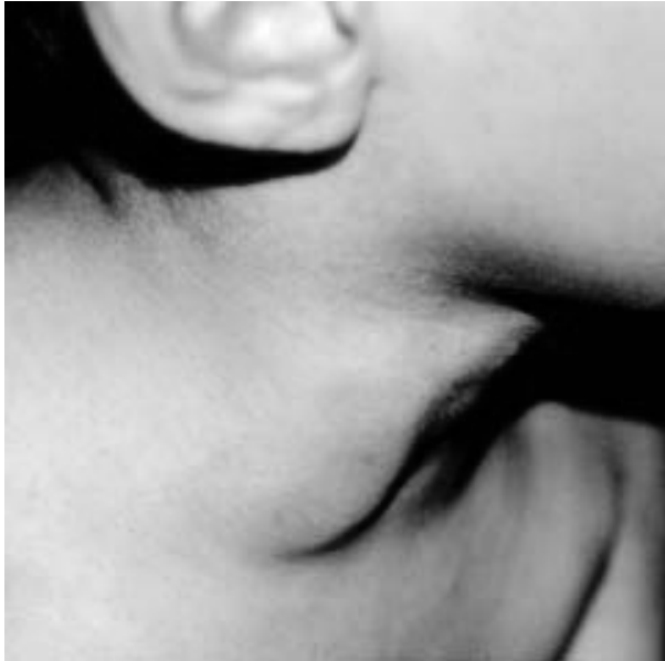
Figura 1. Dilatación cervical lateral derecha que aumenta con los esfuerzos.