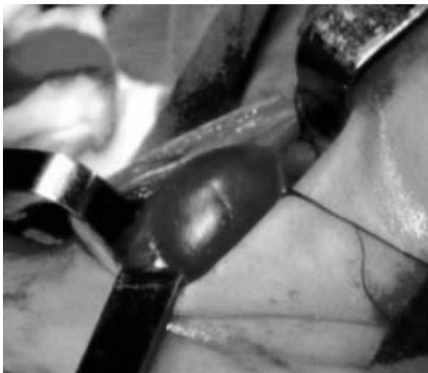
Figura 2. Fotografía transoperatoria que muestra la dilatación anormal de la vena yugular interna derecha.

mostraron aumento de volumen de los tejidos blandos. El ultrasonido reveló una masa quística en ese sitio. Un esófagograma fue normal. El diagnóstico inicial fue linfangioma quístico, pero se pensó en la posibilidad de una FVYI. Se decidió operar al paciente; se realizó una resección a la vena de 6 cm (Fig. 2). El