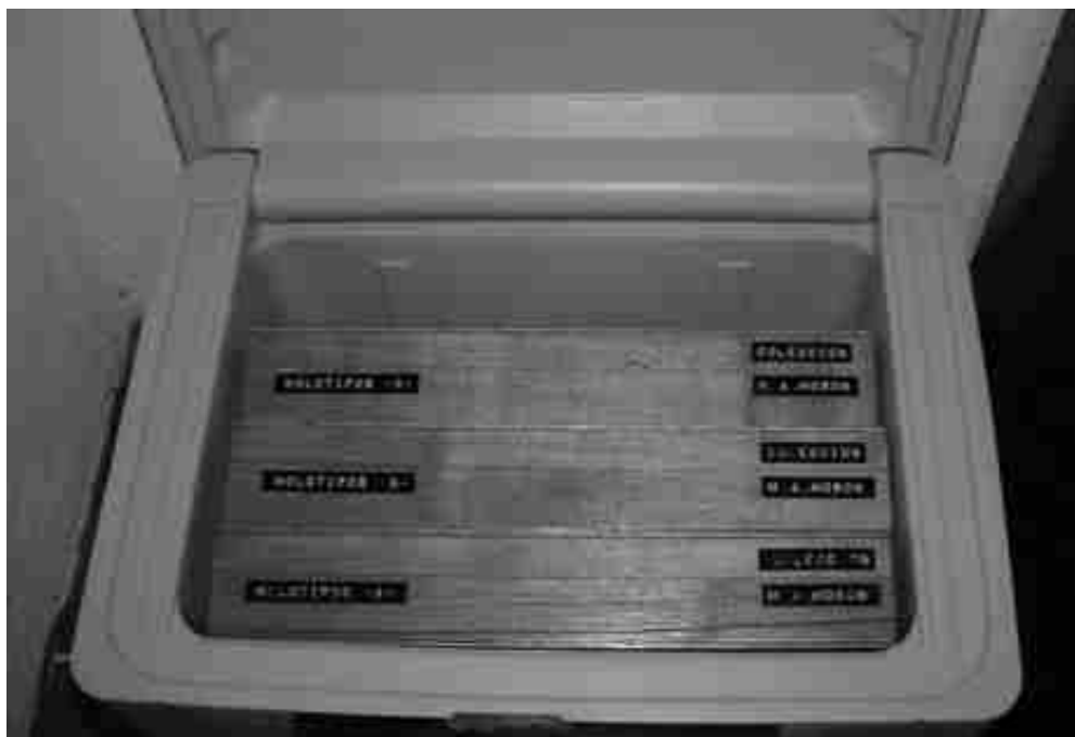
FIGURA 1. Aspecto interior del cofre para resguardar los holotipos depositados en la colección MXAL.

(Fig. 1) aloja cajas de madera de cedro (29 x 22x 5 cm) cada una con seis cajitas de cartón forrado y sellado con celofán transparente incoloro termoadherente que contienen entre seis y diez holotipos cada una (Fig. 2). Dentro de la colección general se han situado etiquetas rojas en los lugares que ocupaban los holotipos, con los datos para localizarlos fácilmente en el cofre (v.g. HOLOTIPO Nayarita viridinota Morón y Nogueira MXAL-0168-1 caja "B").