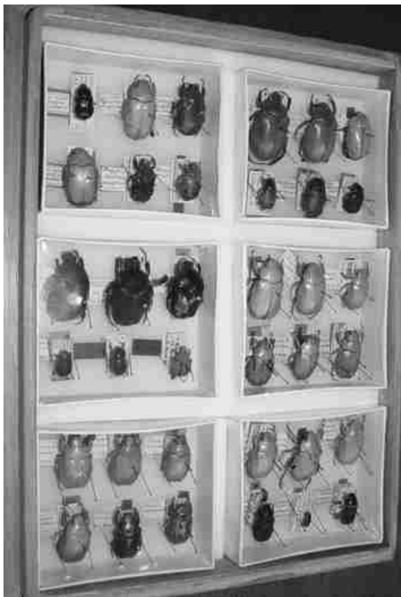
FIGURA 2. Aspecto general de una de las cajas con holotipos depositados en la colección MXAL.