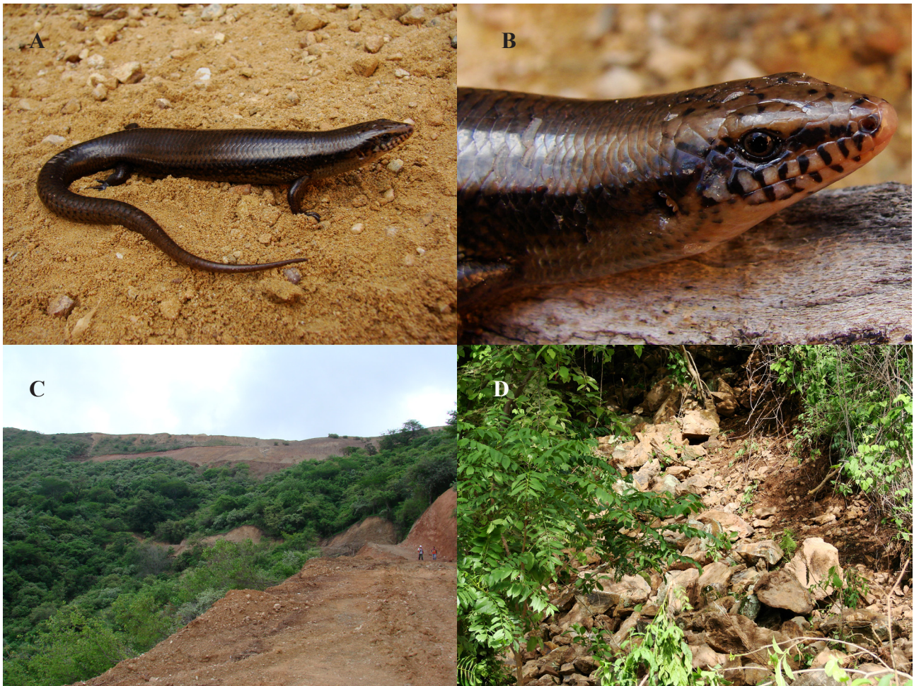
Figura 1. A y B, ejemplar vivo de un macho adulto de M. altimirani (MZFC-21401); C y D, hábitat y microhábitat en la cañada El Naranjo, Campo Morado, Arcelia, Guerrero, México.