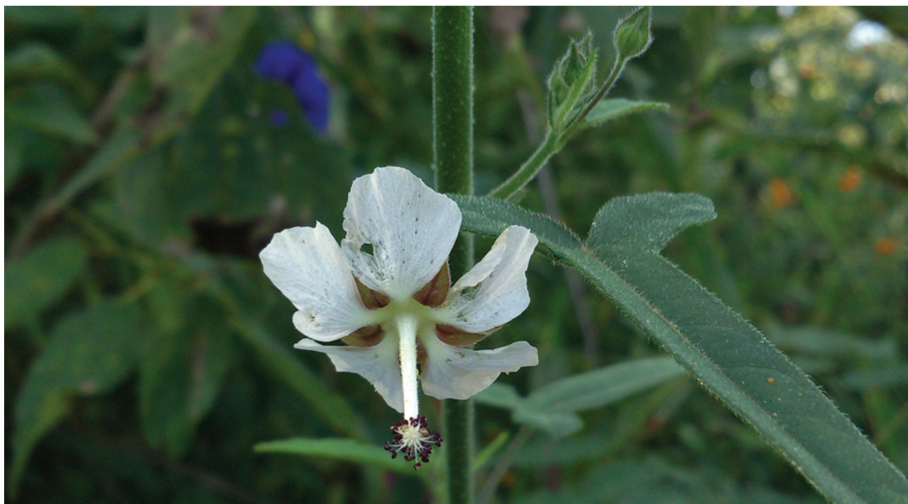
Figura 2. Anoda reflexa sp. nov. Flor en vista frontal.