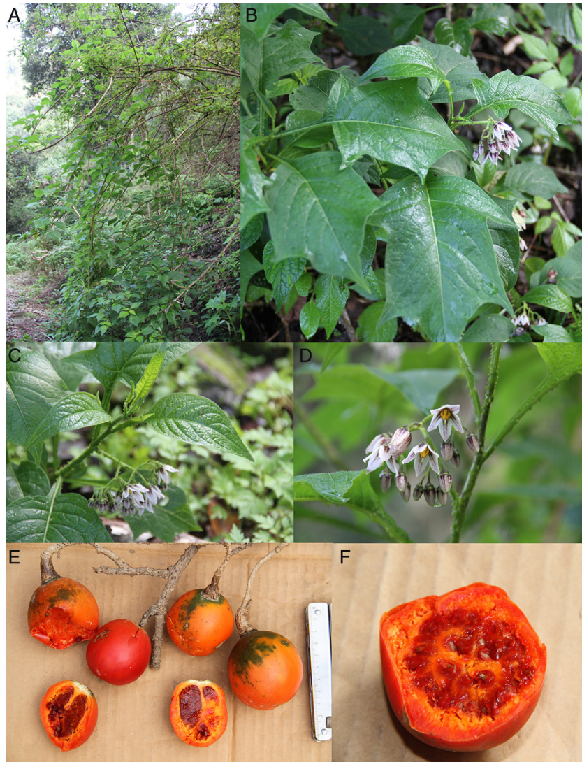
Figura 1. Solanum edmundoi Cuevas et N. M. Núñez. A, hábito de la especie; B, hojas pinnatilobadas en las que se pueden apreciar los lóbulos y la base de la lámina decurrente; C, variación de la hoja, ramillas con aguijones y ramificación de la inflorescencia; D, flores en las que se aprecia el color de la corola, los estambres iguales, y el estilo y parte del estigma (fotos del holotipo); E, frutos en los que puede observarse la variación del color, el tamaño y una sección longitudinal; F, sección transversal de un fruto (E y F, Cuevas, Topete y Solís, 11196).

R. Cuevas, L. Guzmán, E. V. Sánchez y J. G. Morales 11230 (ZEA).