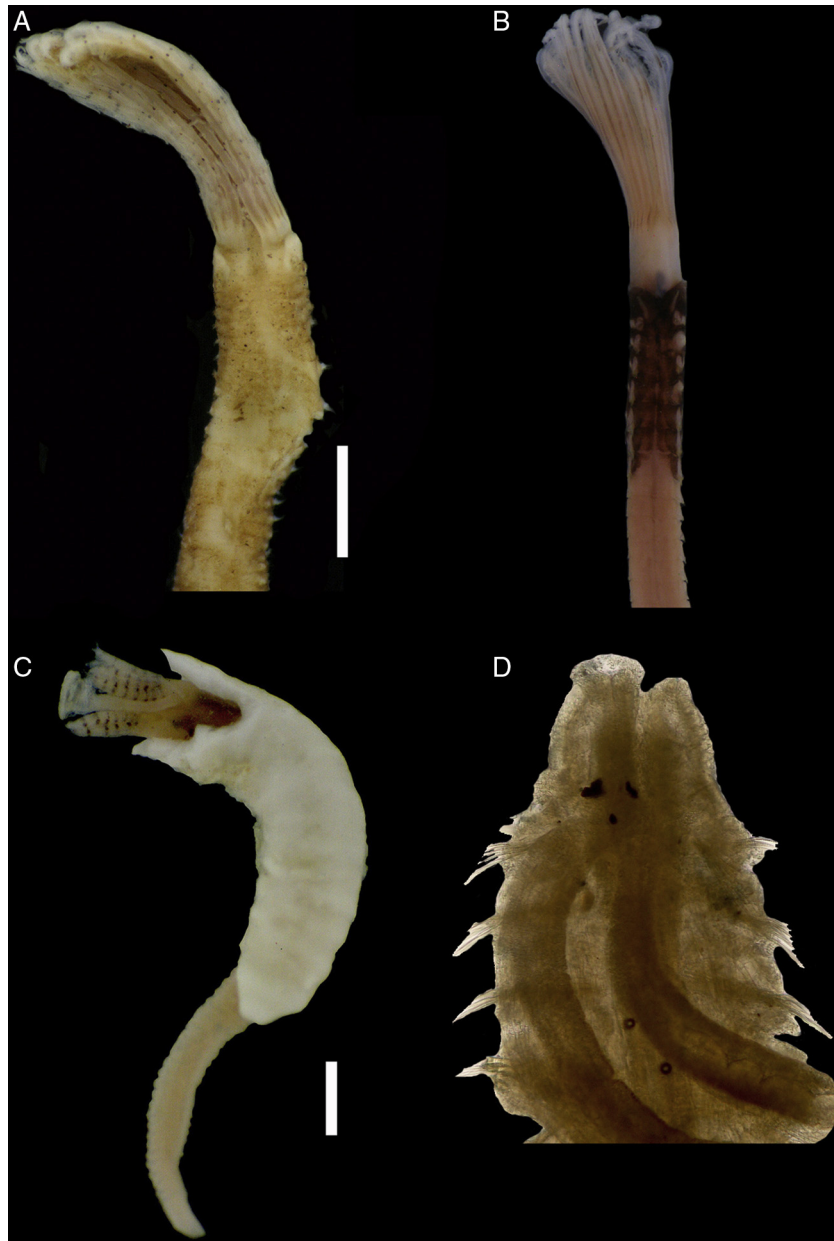
Figura 3. Branchiomma bairdi : A) parte anterior, vista ventral; Notaulax midoculi : B) parte anterior, vista dorsal; Ficopomatus miamiensis : C) organismo completo dentro de su tubo; Pseudopolydora floridensis : D) parte anterior, vista dorsal. Escala: A, B = 1 mm; C, D = 2 mm.