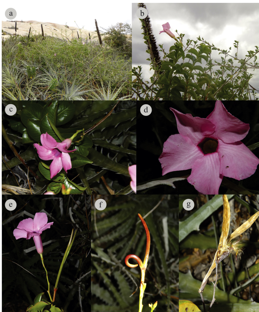
Figura 2. a) Aspecto general de una de las «islas» de vegetación en la que la especie fue recolectada; b-g) Mandevilla dardanoi : b) hábito; c-d) detalle de la flor; e) flores y frutos; f) frutos maduros; g) semillas.

M. dardanoi M. F. Sales, Kinoshita-Gouvêa y A. Simões, Novon 16(1): 113–115. 2006. Tipo: Brasil. Pernambuco: Brejo da Madre de Deus, Prop. Bituri, 5 feb. 1965 (fl, fr), D. Andrade-Lima 4290 (holotipo, IPA 13652) (fig. 2a-g).