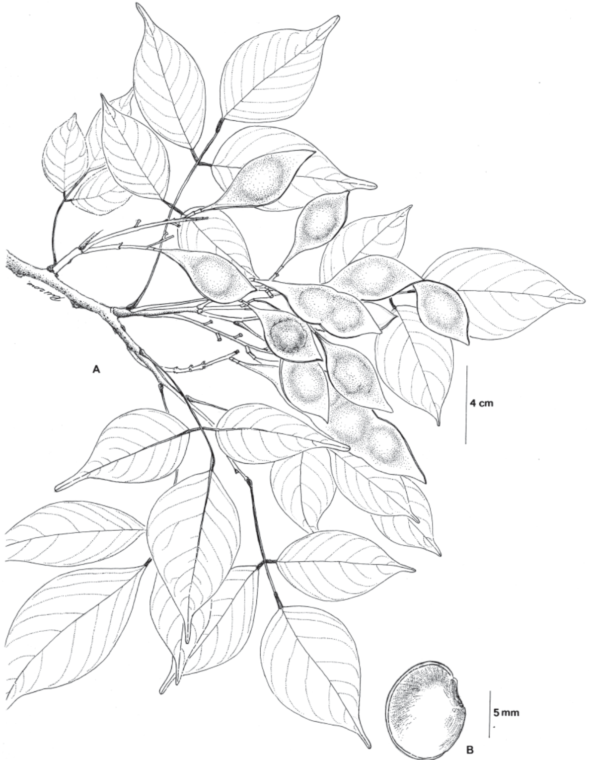
Figura.1. Lonchocarpus haberi M. Sousa. A, rama con hojas e infrutescencias; B, semilla. La rama y semilla fueron tomadas de W. Haber y E. Bello 2939.