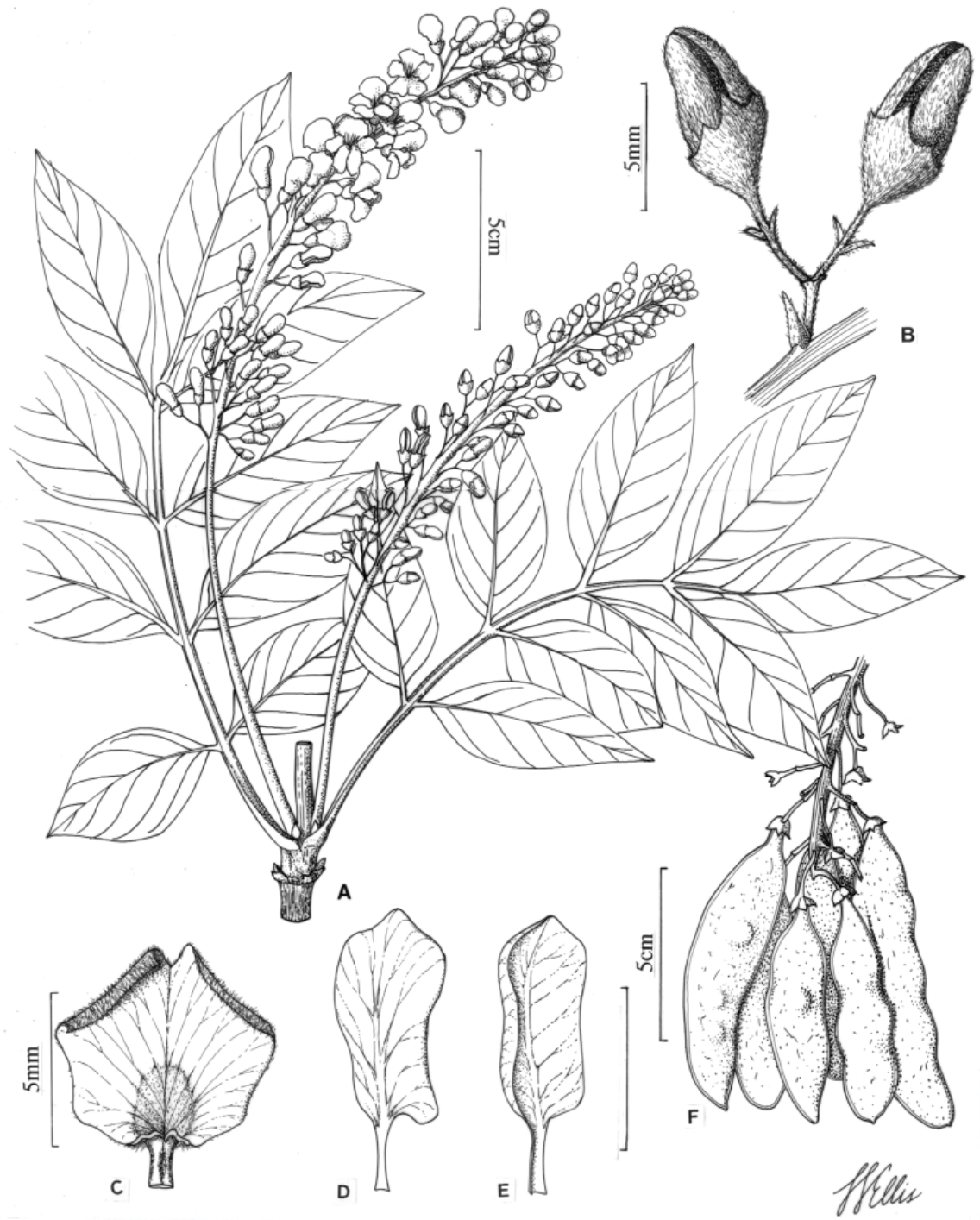
Figura 4. Lonchocarpus montevididis M. Sousa. a, hojas e inflorescencias; b, unidad biflora, mostrando bráctea floral, pedúnculo, pedicelo, bractéolas y botones florales; c, estandarte; d, ala; e, pétalo de la quilla; f, infrutescencia. La rama con hojas, inflorescencia, unidad biflora y partes de la flor fueron tomados de W. Haber et al. 4482 , y la infrutescencia de Haber y Bello 5935 .