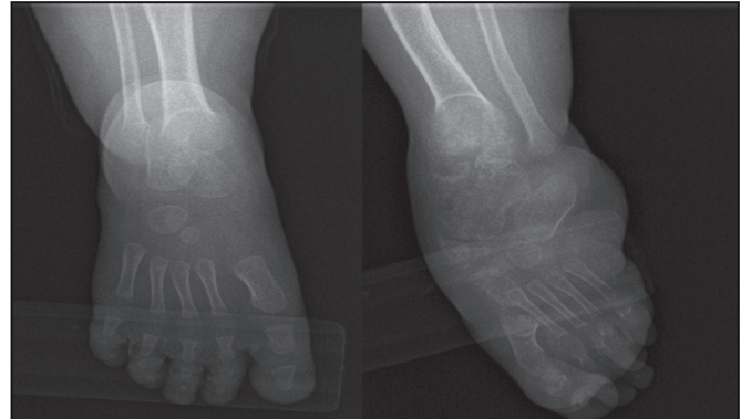
Figura 2. En el pie izquierdo existe compromiso del astrágalo, navicular y primer metatarso, los cuales lucen ensanchados, irregulares y con adelgazamiento de la cortical.

Otros diagnósticos diferenciales de la enfermedad de Trevor descritos en la bibliografía, que no se discuten porque se alejan de las características clínicas del paciente, son: la miositisosificante,