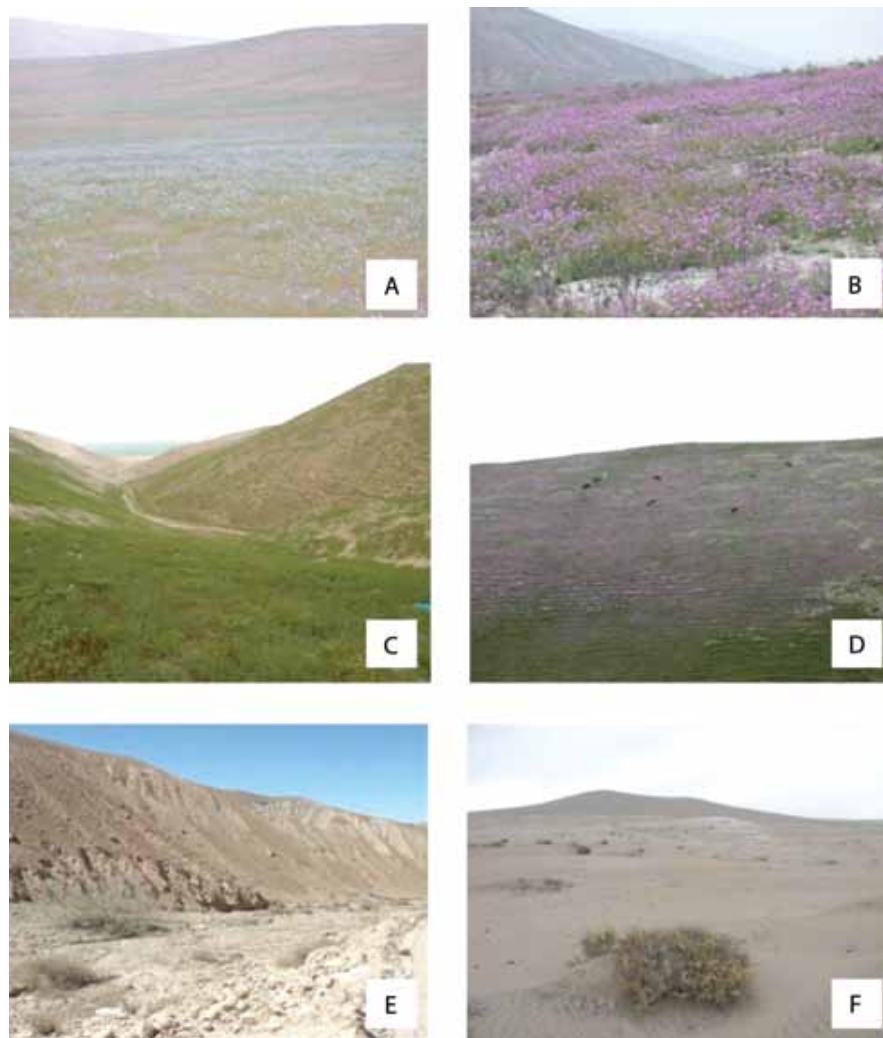
Fig. 1. Comunidades vegetales. (A) Nolano spathulatae - Palauetum dissectae y (B) Hoffmannseggio mirandae - Palauetum weberbaueri , en las lomas de Mejía; (C) Nolanetum scaposum-spathulatae y (D) Palauetum camanensis-weberbaueri , en las lomas de Camaná; (E) Comunidad de Atriplex rotundifolia y Ephedra americana con Schinus molle en el valle Atico-Caravelí; (F) Comunidad marginal de Atriplex rotundifolia y Ephedra americana entre Ocoña y Camaná.