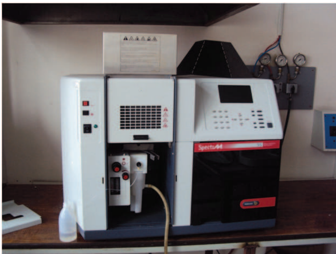
Figura 1. Equipo de Espectrometría de Absorción atómica con llama.

que podrían desencadenar procesos alérgicos para los consumidores o presentarse fenómenos oxidativos indeseados para el fabricante en los productos finales.