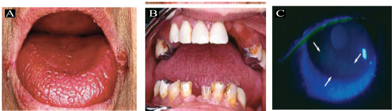
Figura 1. Algunos signos cardinales del Síndrome de Sjögren. A: Xerostomía o boca seca; B: Caries dentales como manifestación clínica de la xerostomía; C: Xeroftalmía u ojo seco. Abundantes microulceraciones características del síndrome (flechas).

Años atrás se hacía referencia al SS como sinónimo de la enfermedad de Mikulicz por compartir similitudes en su presentación clínica caracterizada por inflamación bilateral de las glándulas salivares y lacrimales sin estar asociado estos signos clínico patológicos con otra condi-