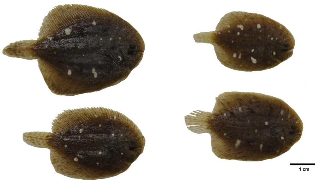
Figura 3. Hipomelanosis en la especie A. mazatlanus LACM W-51-15.