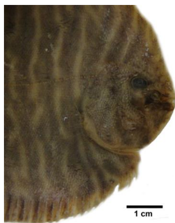
Figura 5. Ausencia del ojo inferior en la especie A. scutum LACM 33805-23.