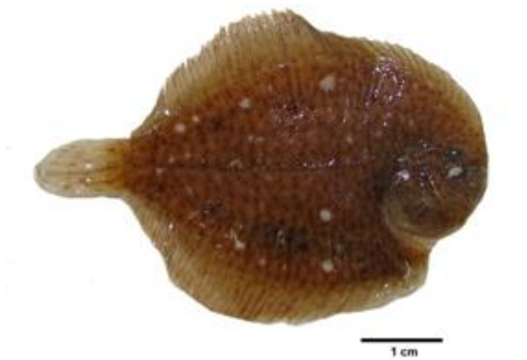
Figura 2. Hipomelanosis de A. lineatus , CNPE-IBUNAM 1007.