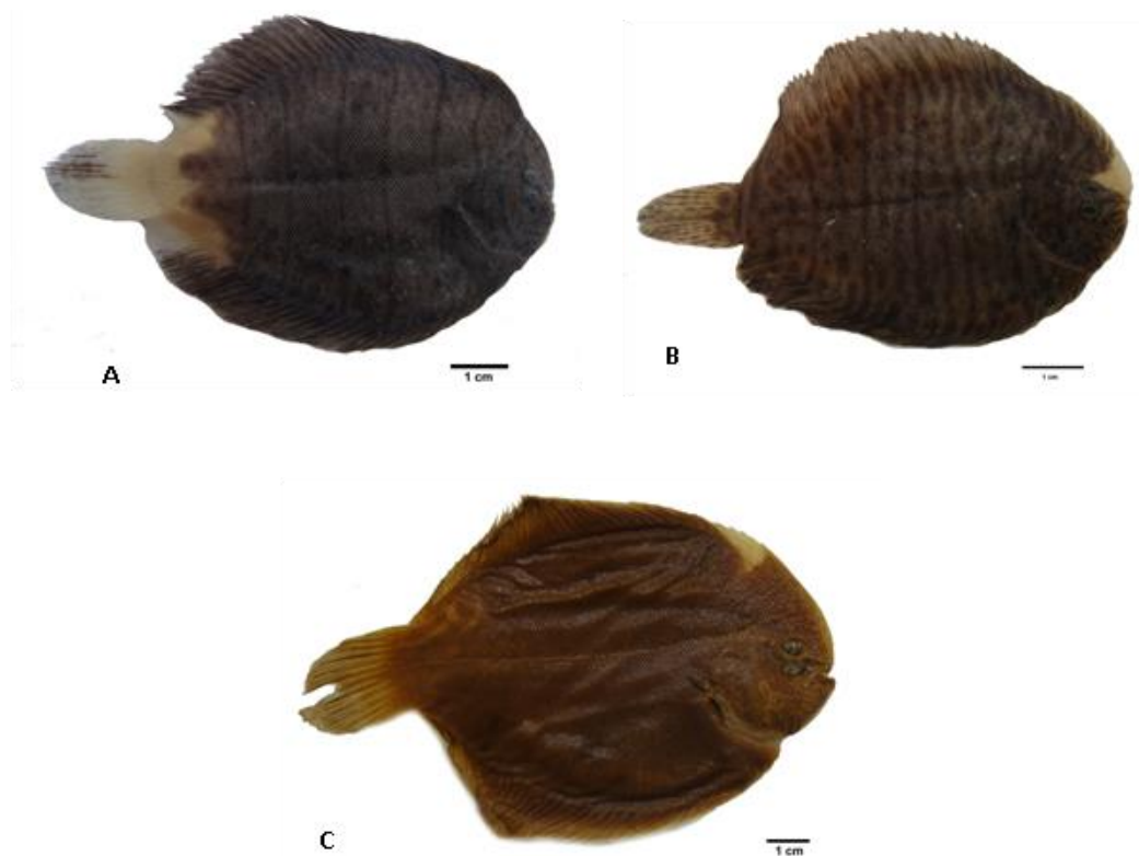
Figura 4. Hipermelanosis de lado ciego de (A) Achirus sp. ECOSUR6169, (B) Achirus sp. ECOSUR 6065 y (C) A. mazatlanus LACM 24412.