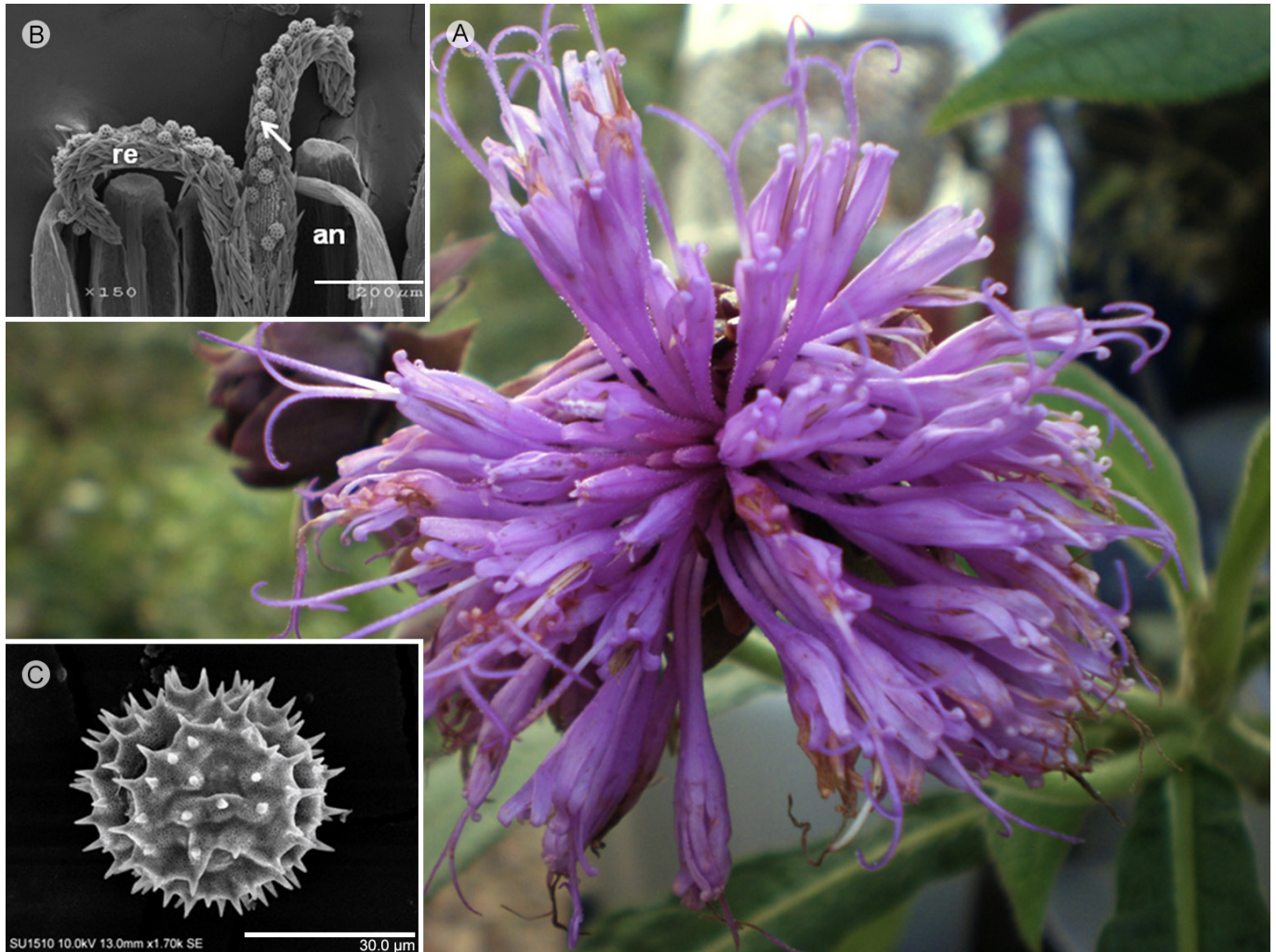
Figura 1: Características distintivas de Vernonieae. A. cabezuela de Lepidonia callilepis (Gleason) H. Rob. & V.A. Funk; B. flor de Elephantopus mollis Kunth, mostrando las ramas del estilo pilosas, re: ramas del estilo, an: antera, la flecha señala los granos de polen; C. polen de L. callilepis con ornamentación equinada.

esta última su grupo hermano (Bremer, 1987; Keeley y Turner, 1990; Jansen et al., 1991; Keeley y Jansen, 1994; Kim y Jansen, 1995; Panero y Funk, 2002, 2008; Funk et al., 2005, 2009; Robinson, 2007; Robinson y Funk, 2011).