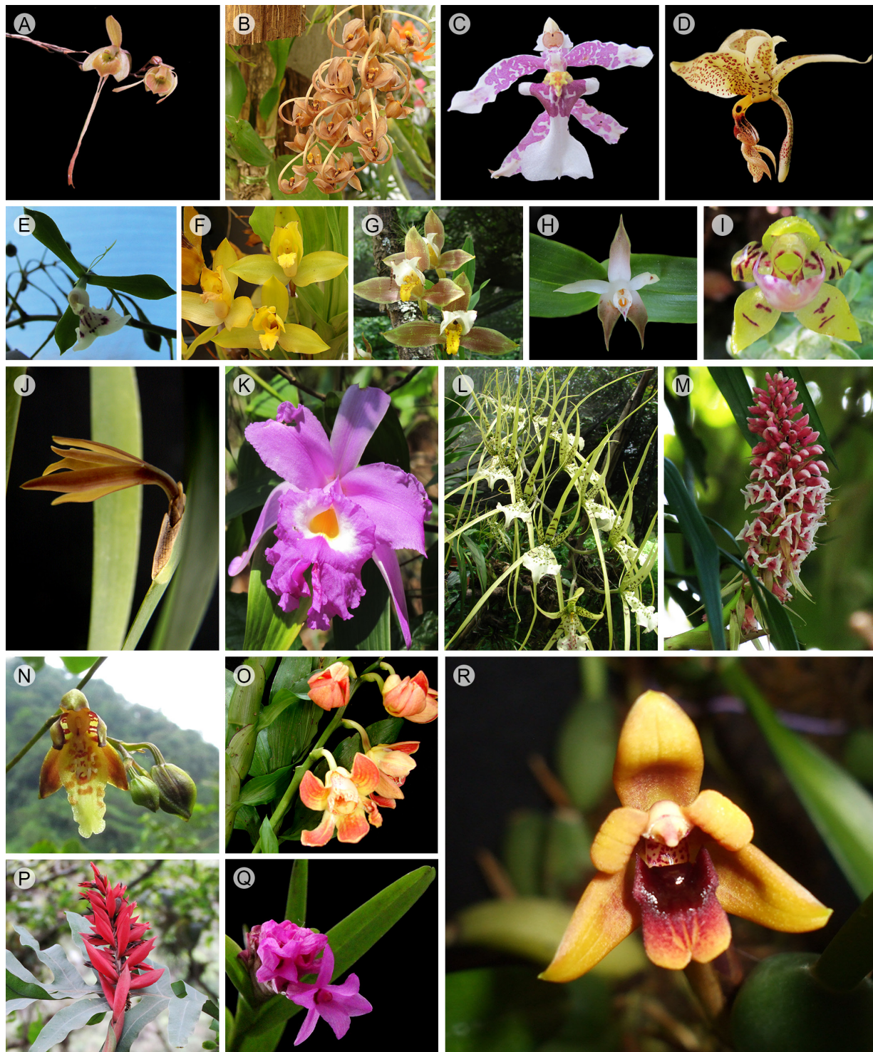
Figura 2: Especies de orquídeas presentes en el bosque mesófilo de montaña de la región suroeste de Chocamán, Veracruz. Especies endémicas de México: A. Epidendrum longipetalum A. Rich. & Galeotti; B. Gongora galeata (Lindl.) Rchb.f.; especies incluidas en la NOM-059-SEMARNAT-2010: C. Oncidium incurvum Barker ex Lindl.; D. Stanhopea oculata (G. Lodd.) Lindl. Otras especies que conformaron la riqueza de orquídeas de la zona de estudio: E. Epidendrum veroscriptum Hágsater; F. Lycaste aromatica (Graham ex Hook.) Lindl.; G. L. deppei (Lodd.) Lindl.; H. Prosthechea pseudopygmaea (Finet) W.E. Higgins; I. Dichaea neglecta Schltr.; J. Jacquiella equitantifolia (Ames) Dressler; K. Sobralia macrantha Lindl.; L. Brassia verrucosa Bateman ex Lindl.; M. Coelia macrostachya Lindl.; N. Leochilus carinatus (Knowles & Westc.) Lindl.; O. Chysis leavis Lindl.; P. Stenorrhynchos cf. glicensteinii Christenson; Q. Ischilus major Schltdl. & Cham.; R. Maxillariella variabilis (Bateman ex Lindl.) M.A. Blanco & Carnevali.