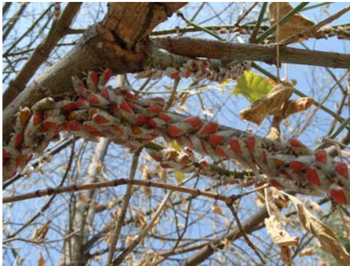
Figura 1b. Detalle de la colonia de Metcalfiella monogramma (Germar).