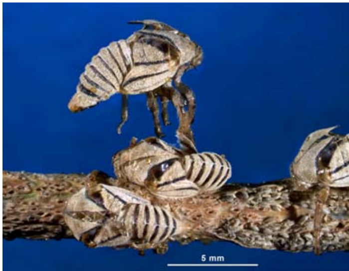
Figura 3. Exhuvias de Metcalfiella monogramma (Germar), adheridas todavía a su hospedero Acer negundo subsp. mexicanum (DC.) Wesm.