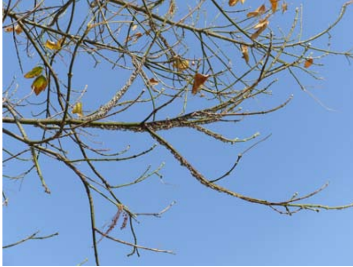
Figura 1a. Infestación de Metcalfiella monogramma (Germar) en su hospedero Acer negundo subsp. mexicanum (DC.) Wesm.