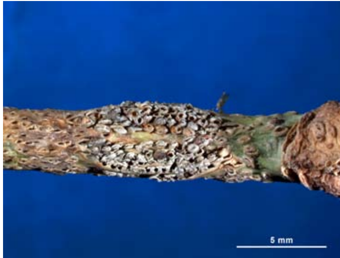
Figura 2. Masa de huevecillos de Metcalfiella monogramma (Germar), en ellos se puede observar el opérculo de emergencia de las ninfas.