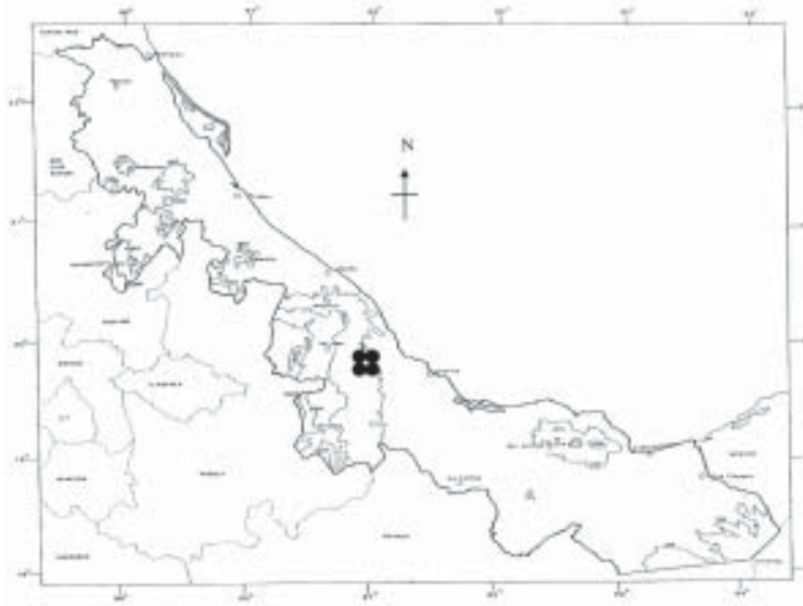
Fig. 2. Distribución de P. teretifolium Kuijt en el estado de Veracruz.

La especie prospera en un clima considerado tropical, con una marcada época de sequía hasta de seis meses en los meses de invierno y primavera, con lluvias en verano, temperatura media anual cercana a los 25° C y con precipitación media anual entre los 900 a 1100 mm. Suelo de color oscuro, casi negro, con abundantes rocas calizas